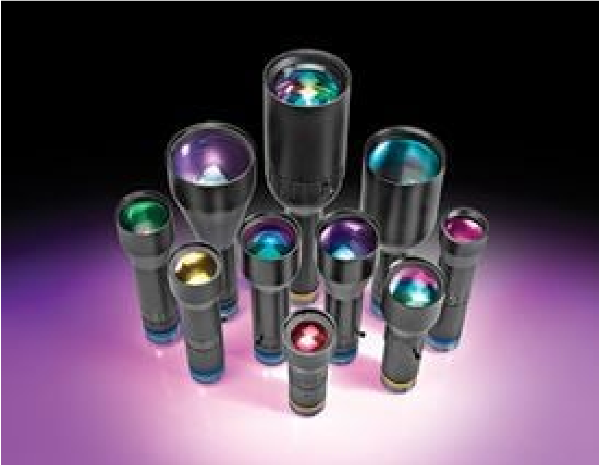
SilverTL™ Telecentric Lenses