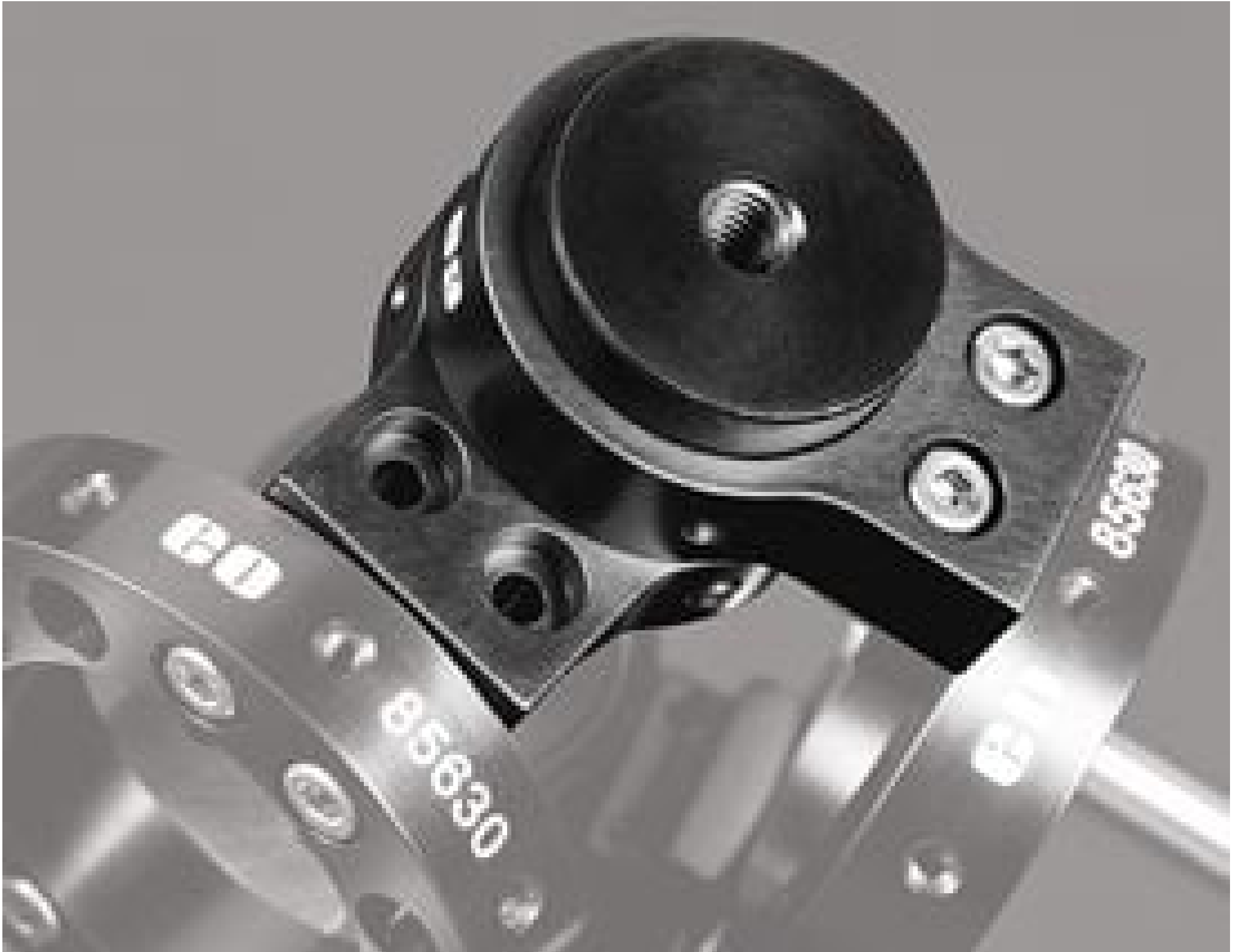
TECHSPEC® Swivel Joint Add-On Kit