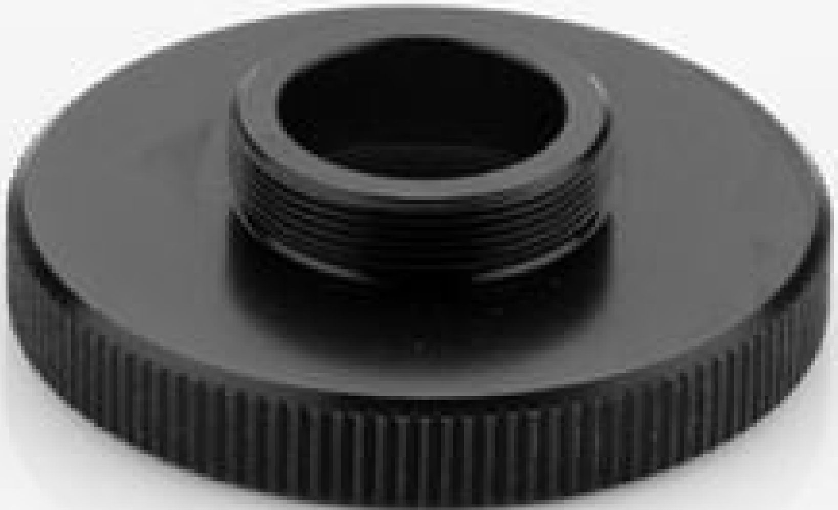
#58-184: C-Mount Adapter for 12 Position Filter Wheel and Assembly