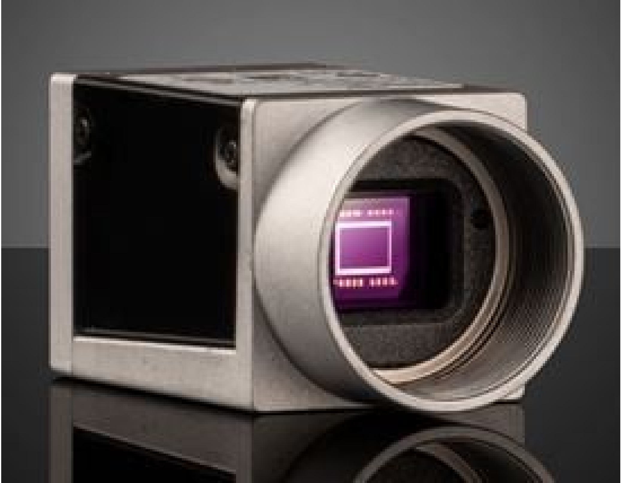
Basler ace GiGE Cameras