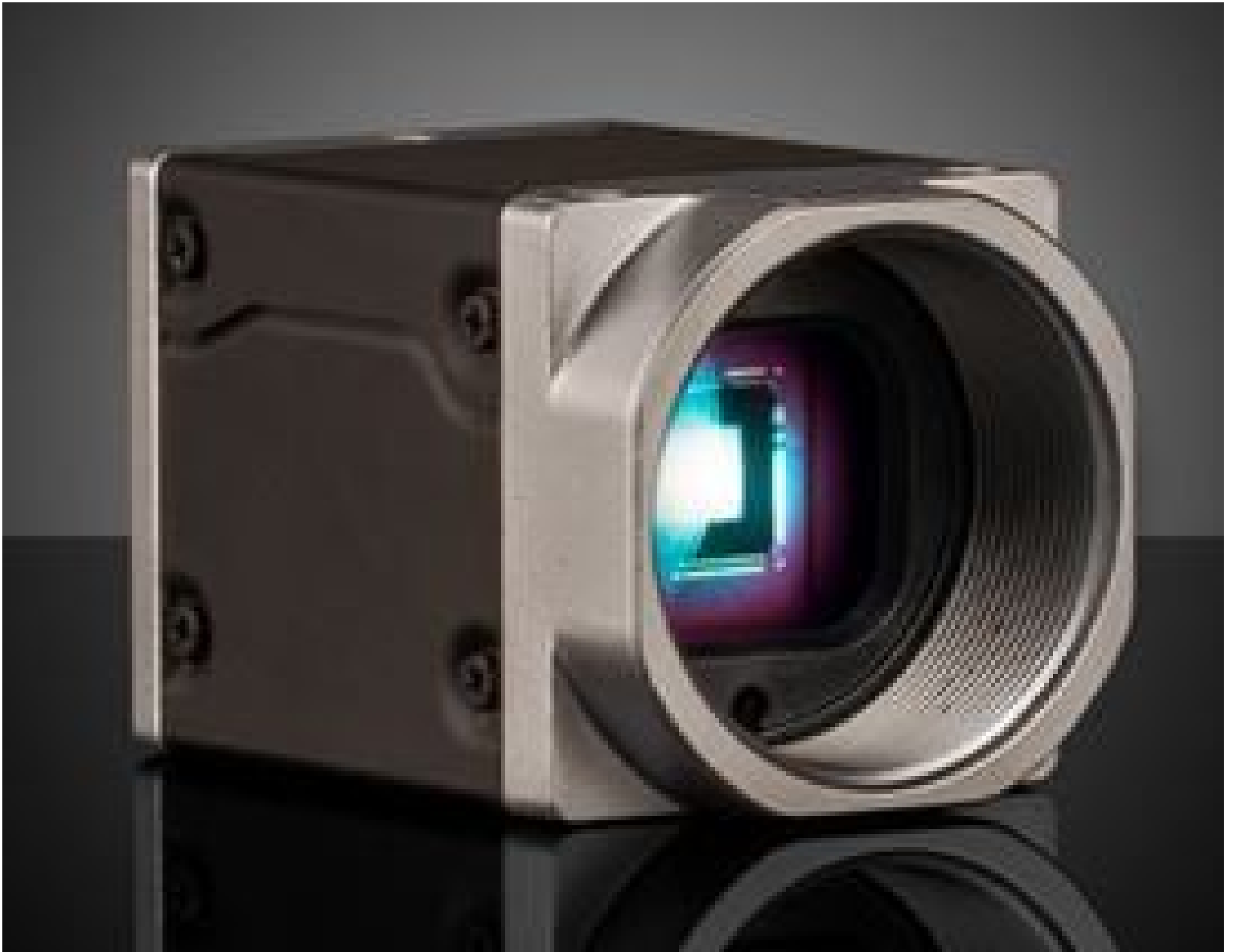
Basler ace2 USB 3.0 Cameras (Front)