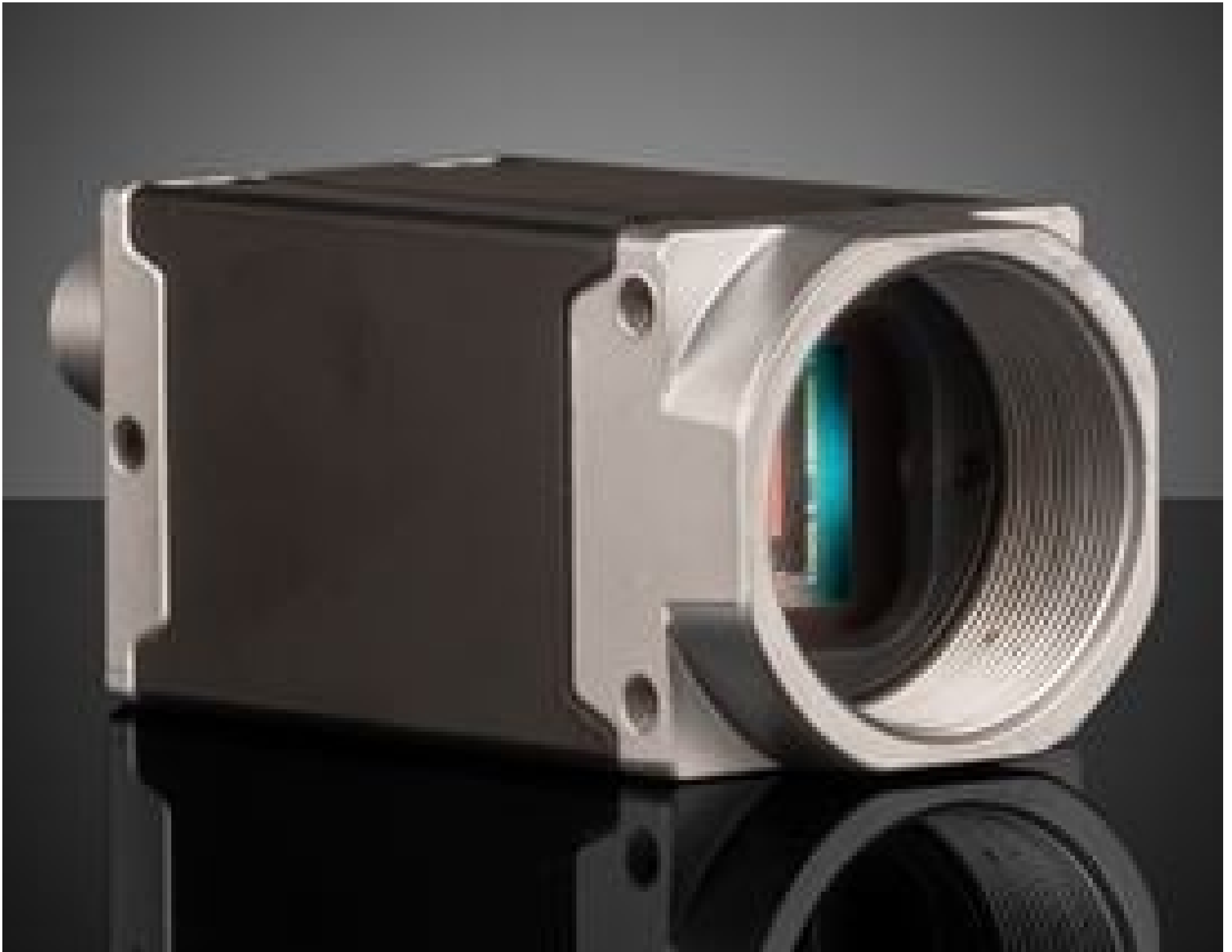
Basler ace2 GigE Cameras (Front)