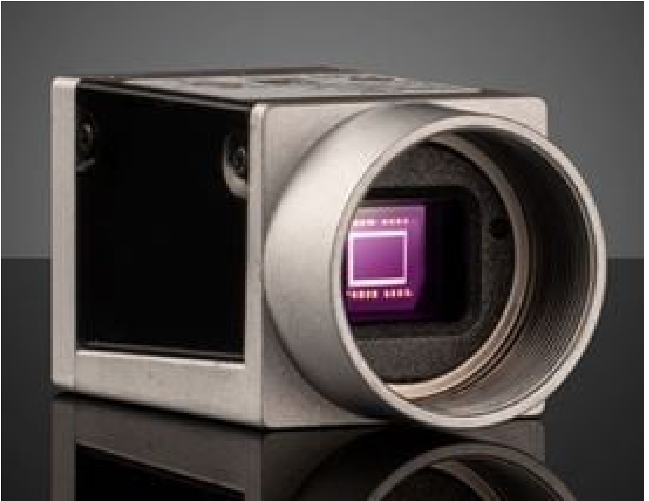
Basler ace GigE Cameras