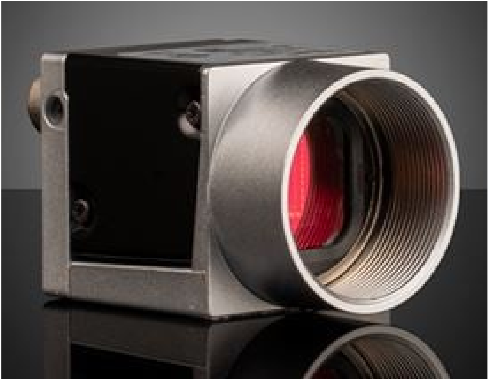
Basler ace USB 3.0 Cameras (Front)