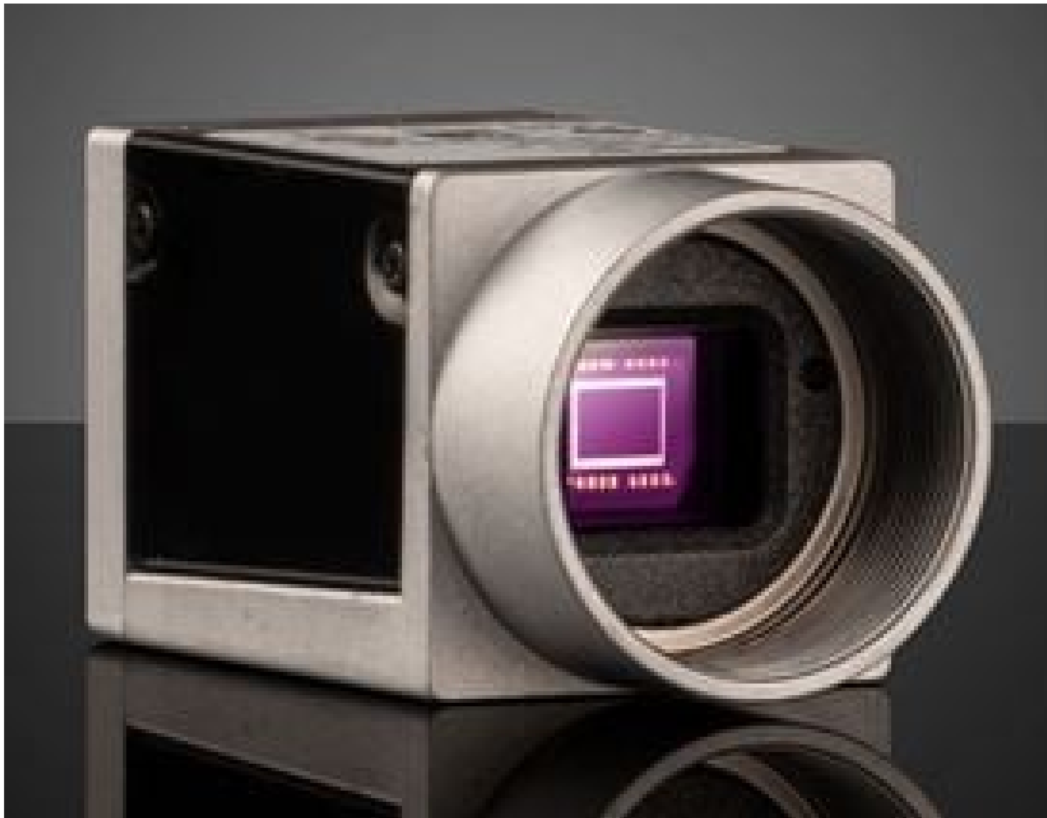
Basler ace GigE Cameras