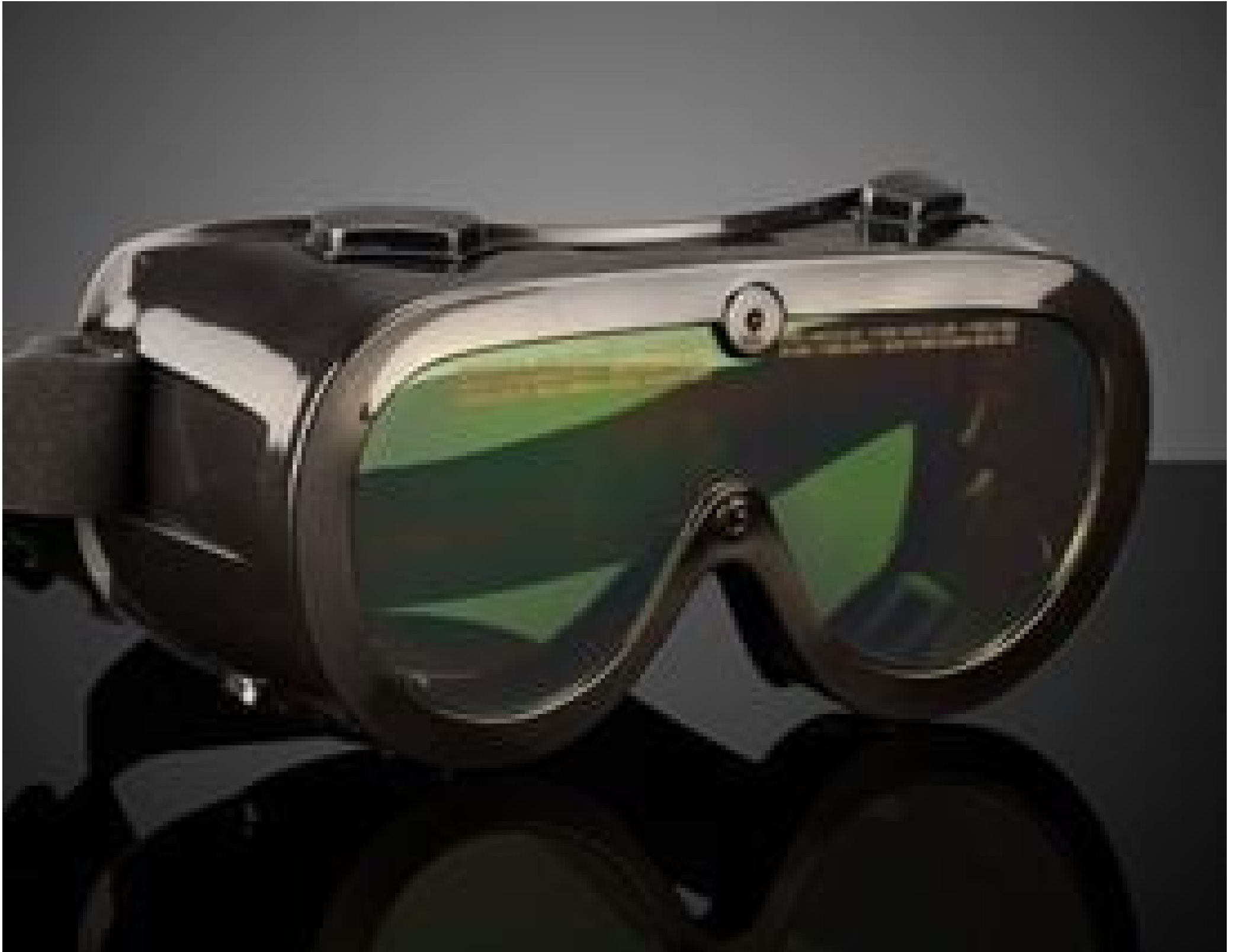
Image represents frame style only. Filter color will vary by product specification.