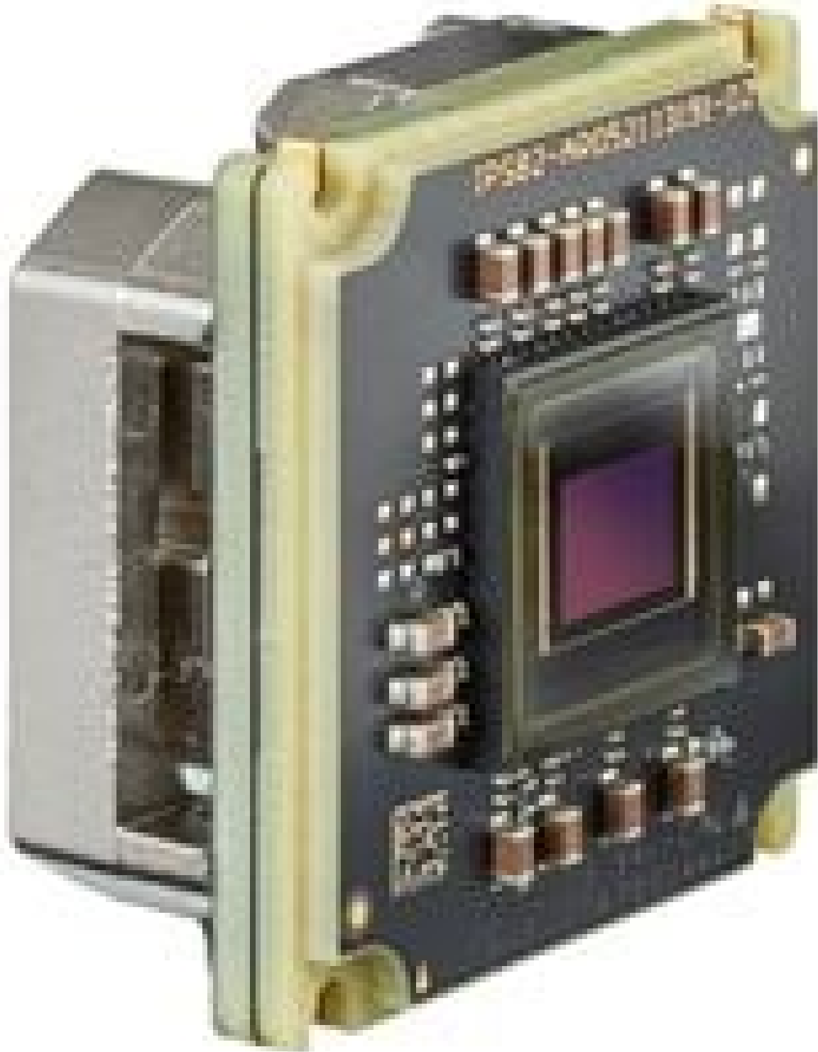
Allied Vision Alvium Camera, Board Level (Front)