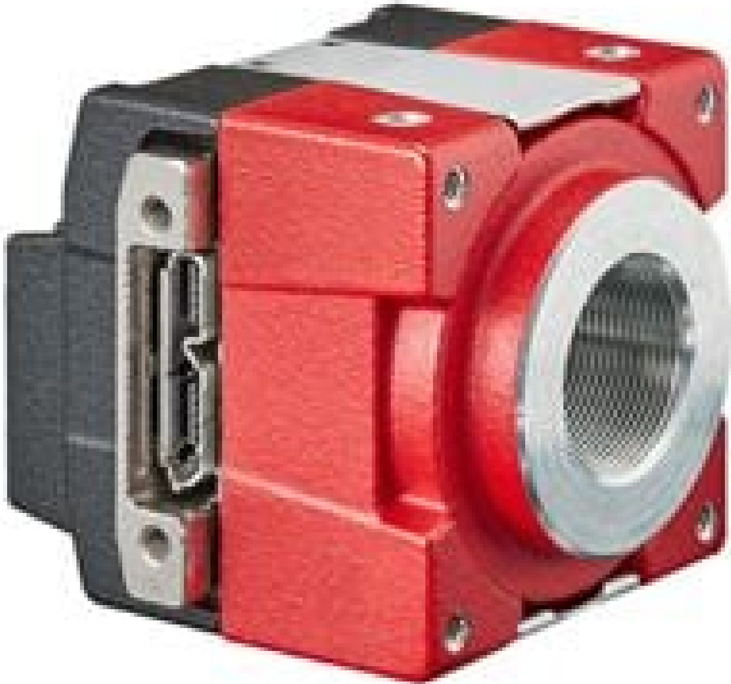
Allied Vision Alvium Camera, Full Housing, S-Mount, Right Angle IO Port (Front)