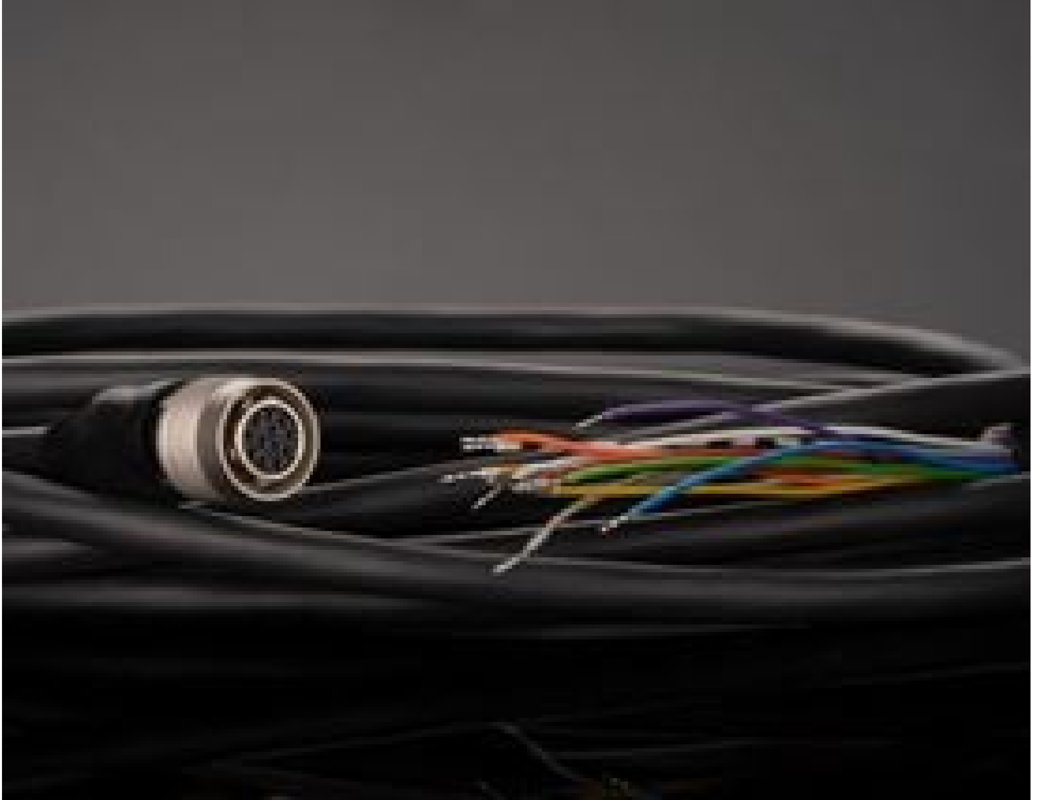
12-pin Hirose I/O Cable, 5m (#62-712)