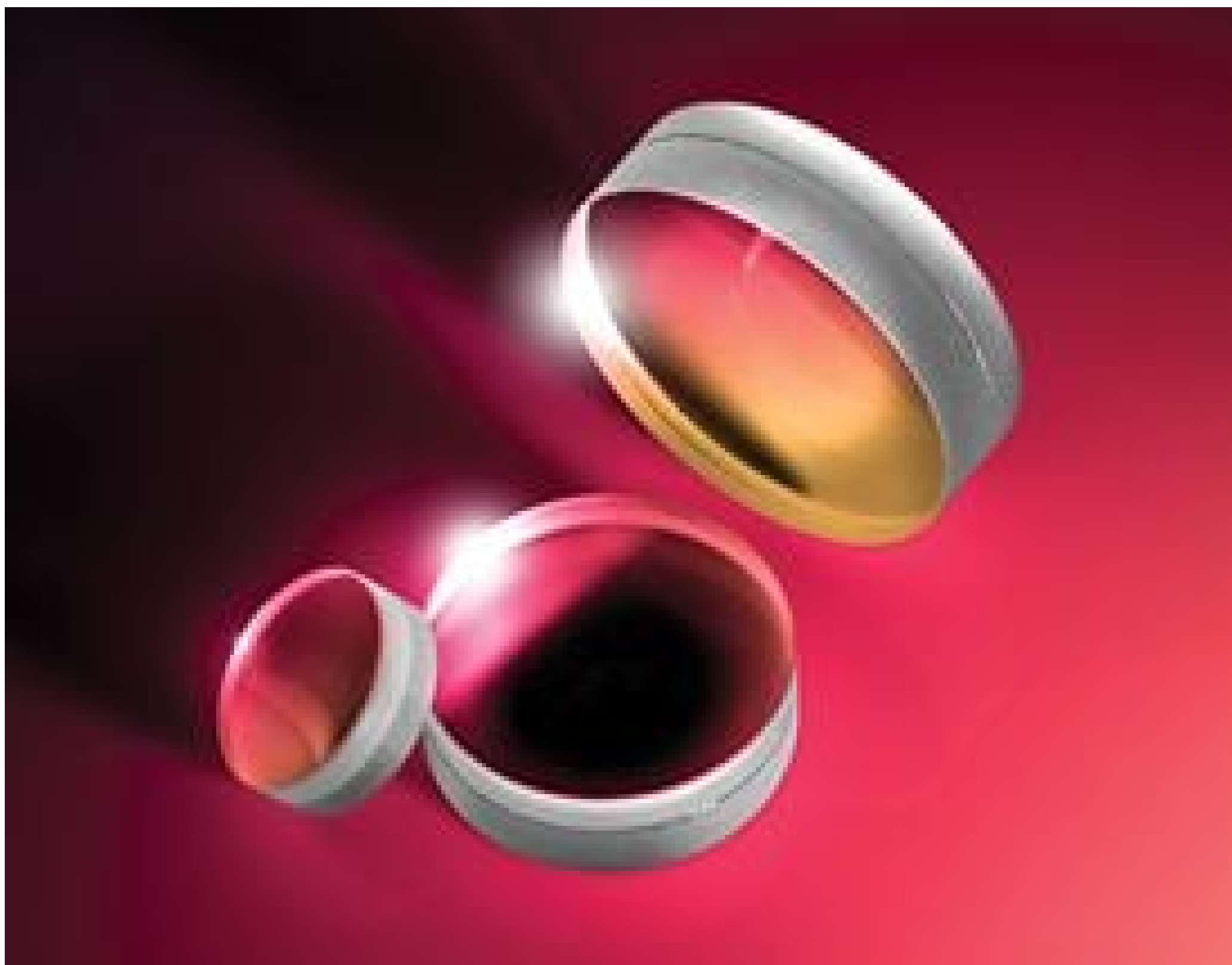
YAG-BBAR Coated Achromatic Lenses