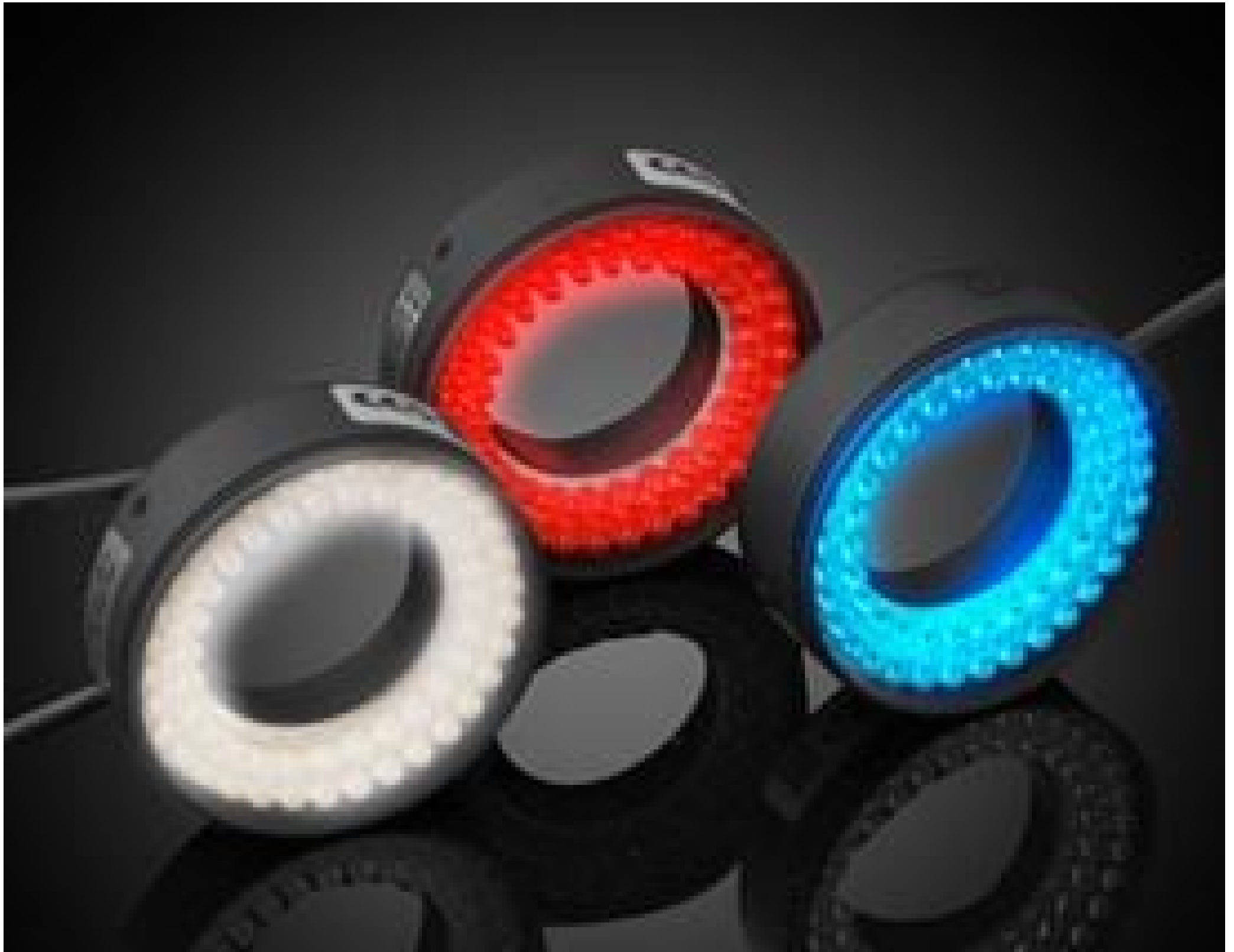
CCS High-Angle LED Ring Lights