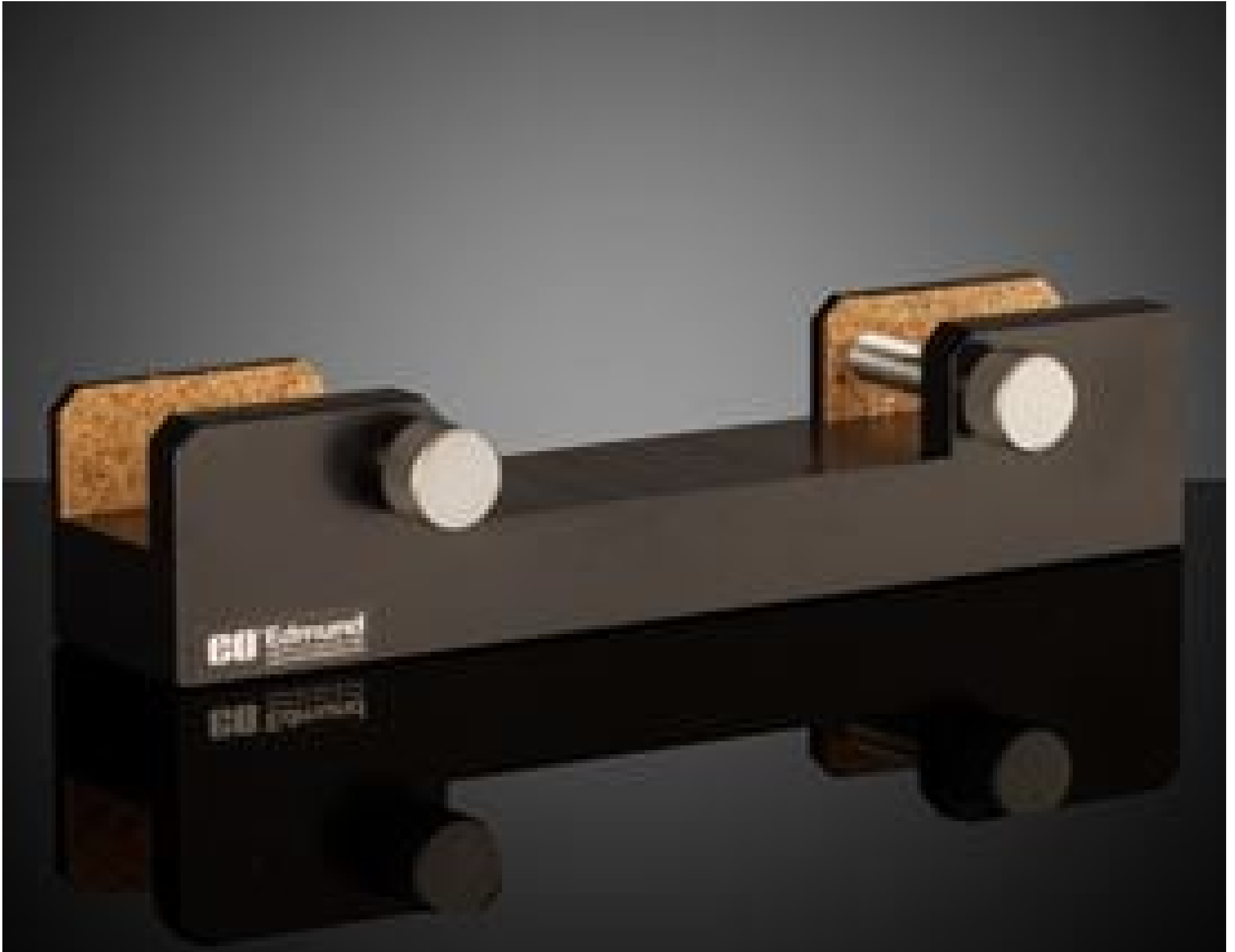
80mm Sq., Fixed Filter Holder