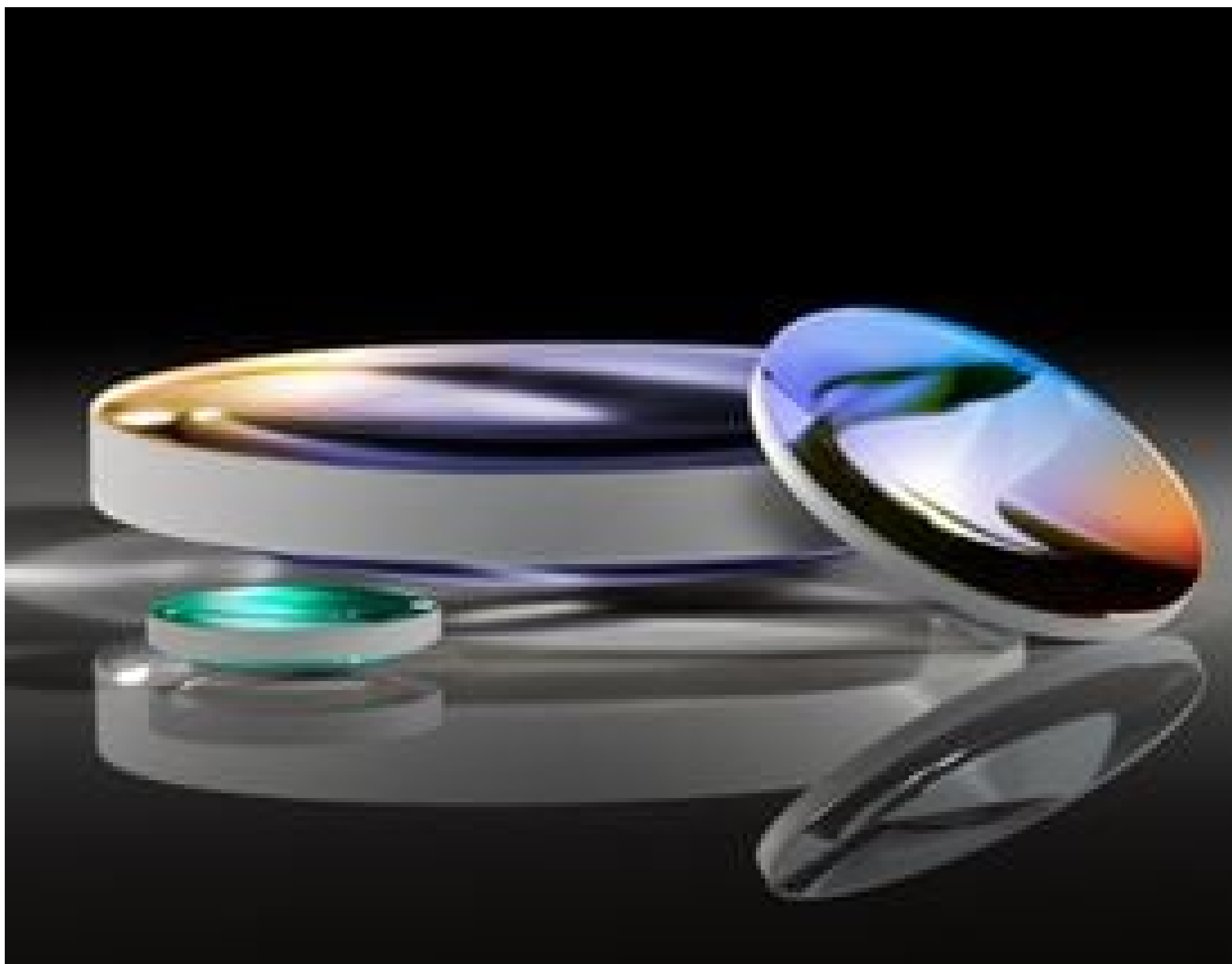
YAG-BBAR Coated Plano-Convex (PCX) Lenses