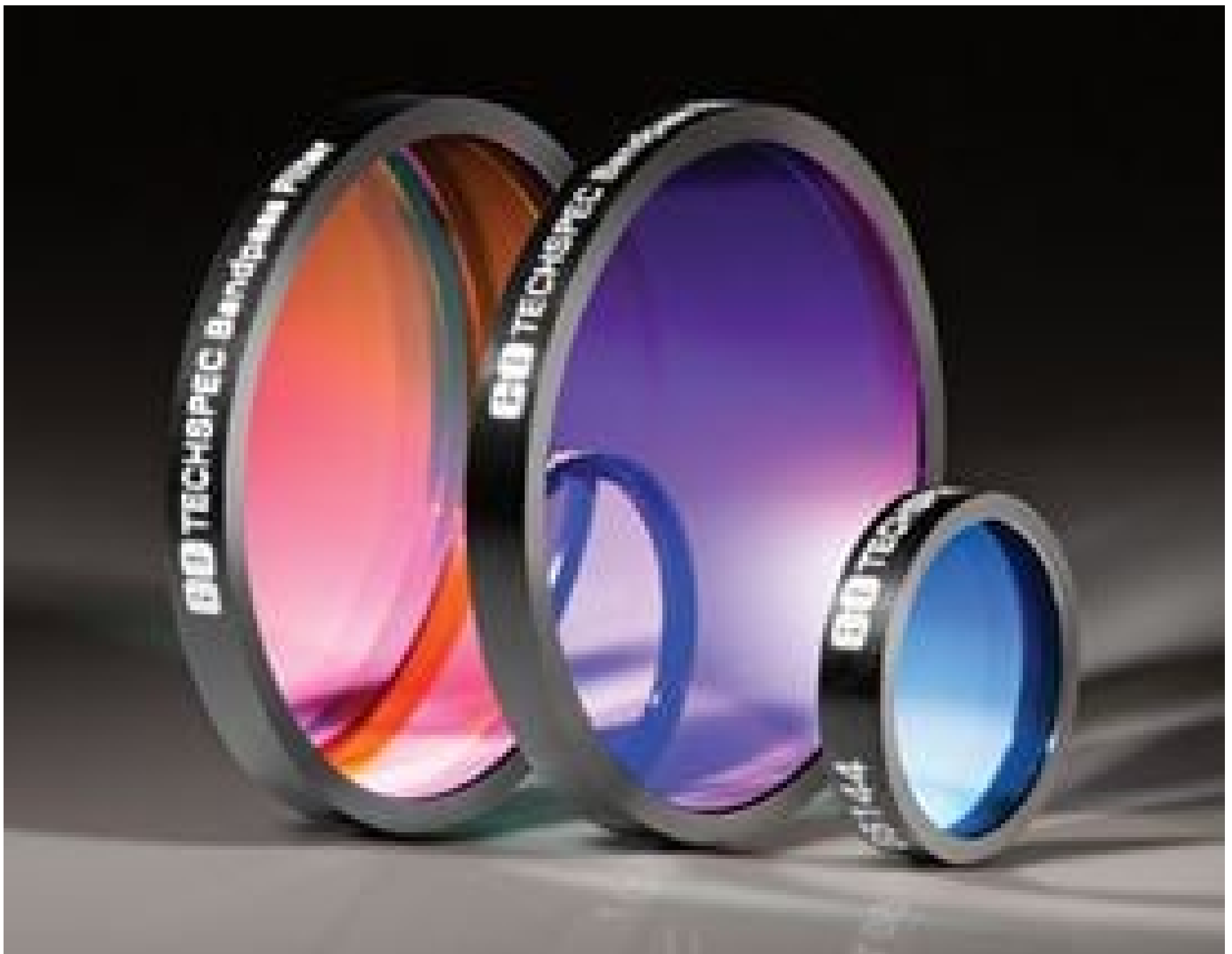
TECHSPEC Hard Coated OD 4.0 5nm Bandpass Filters