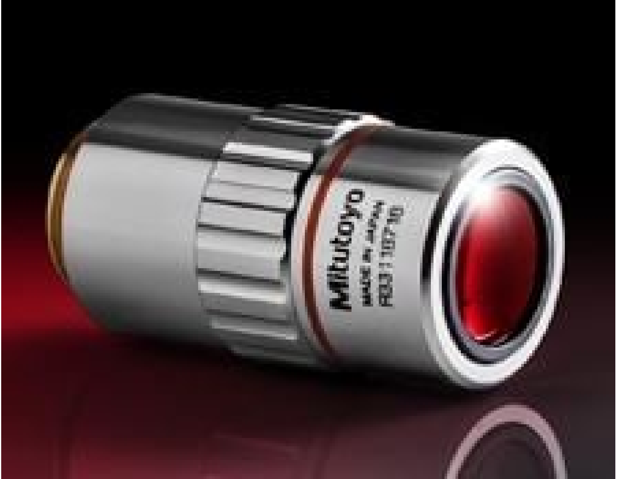
7.5X Mitutoyo Plan Apo Infinity Corrected Long WD Objective, #66-383