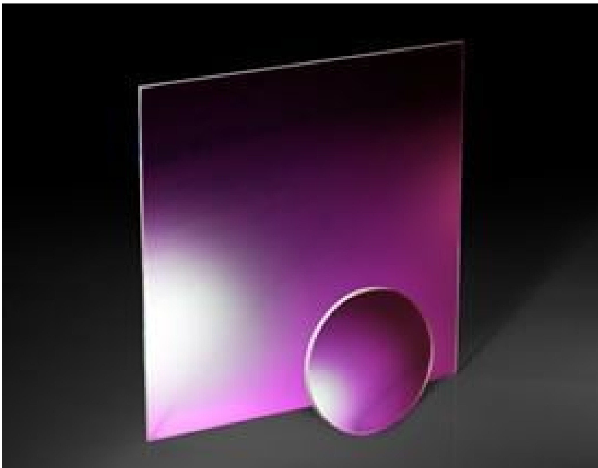
EAGLE XG® Windows