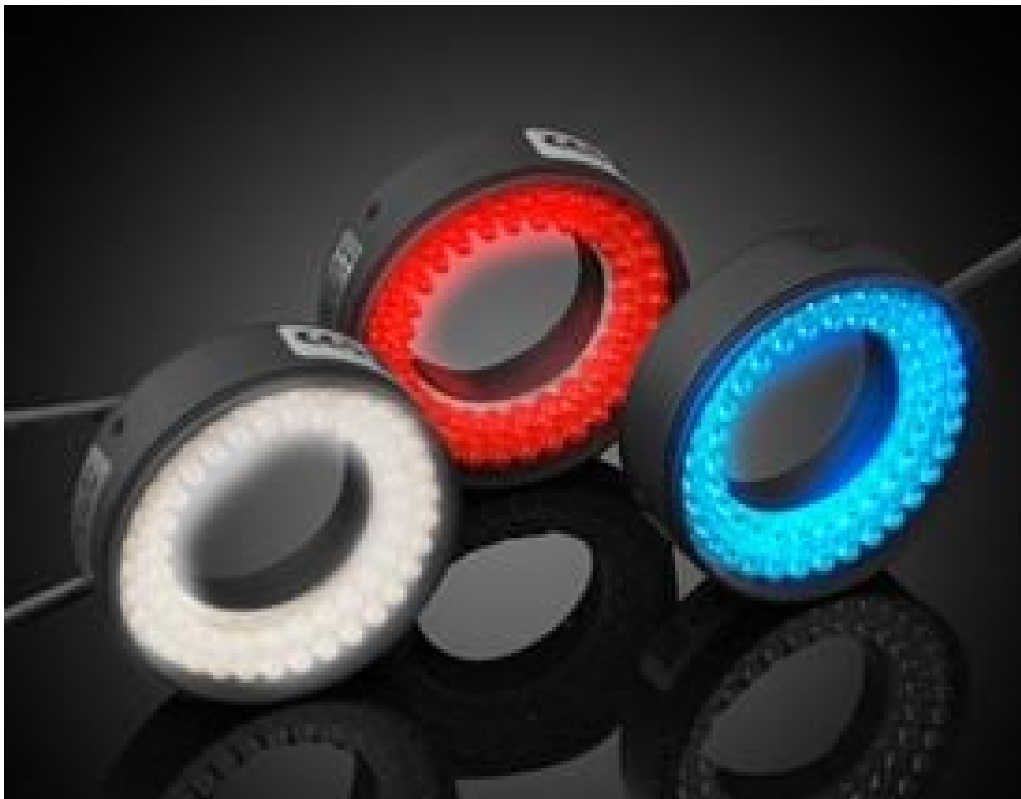
CCS High-Angle LED Ring Lights