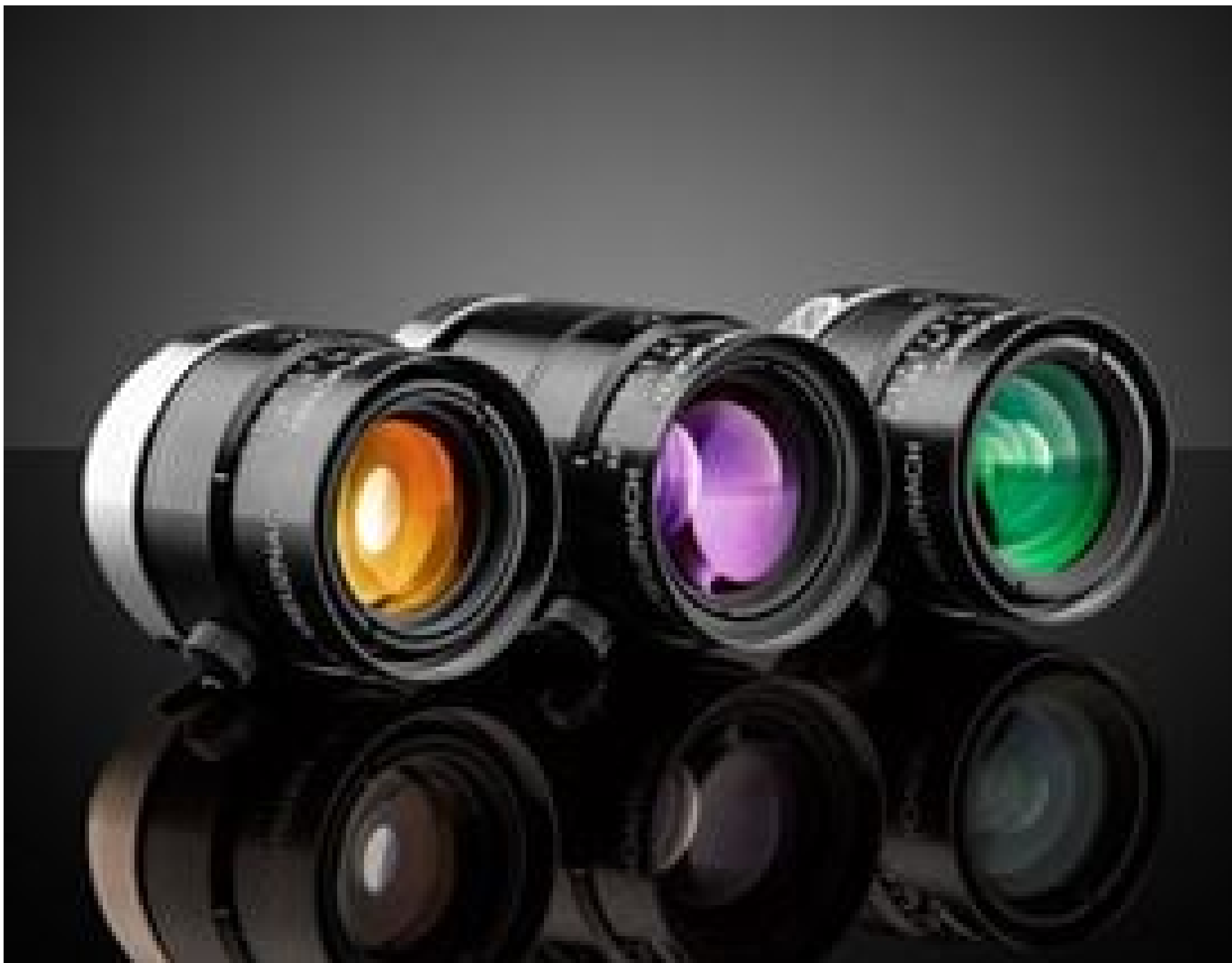
Schneider Compact MS-NIR Lenses