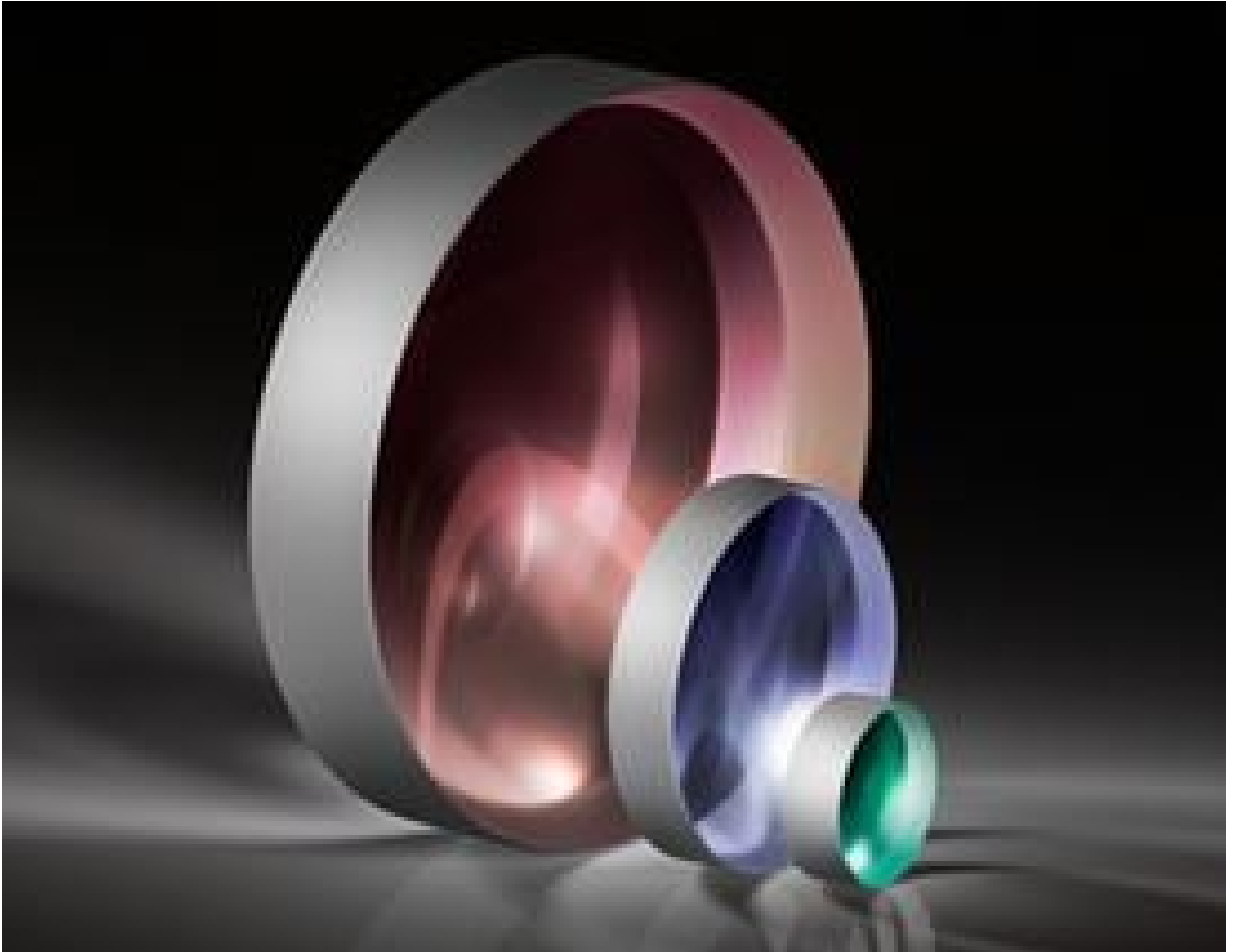
TECHSPEC VIS-NIR Coated Plano-Concave (PCV) Lenses