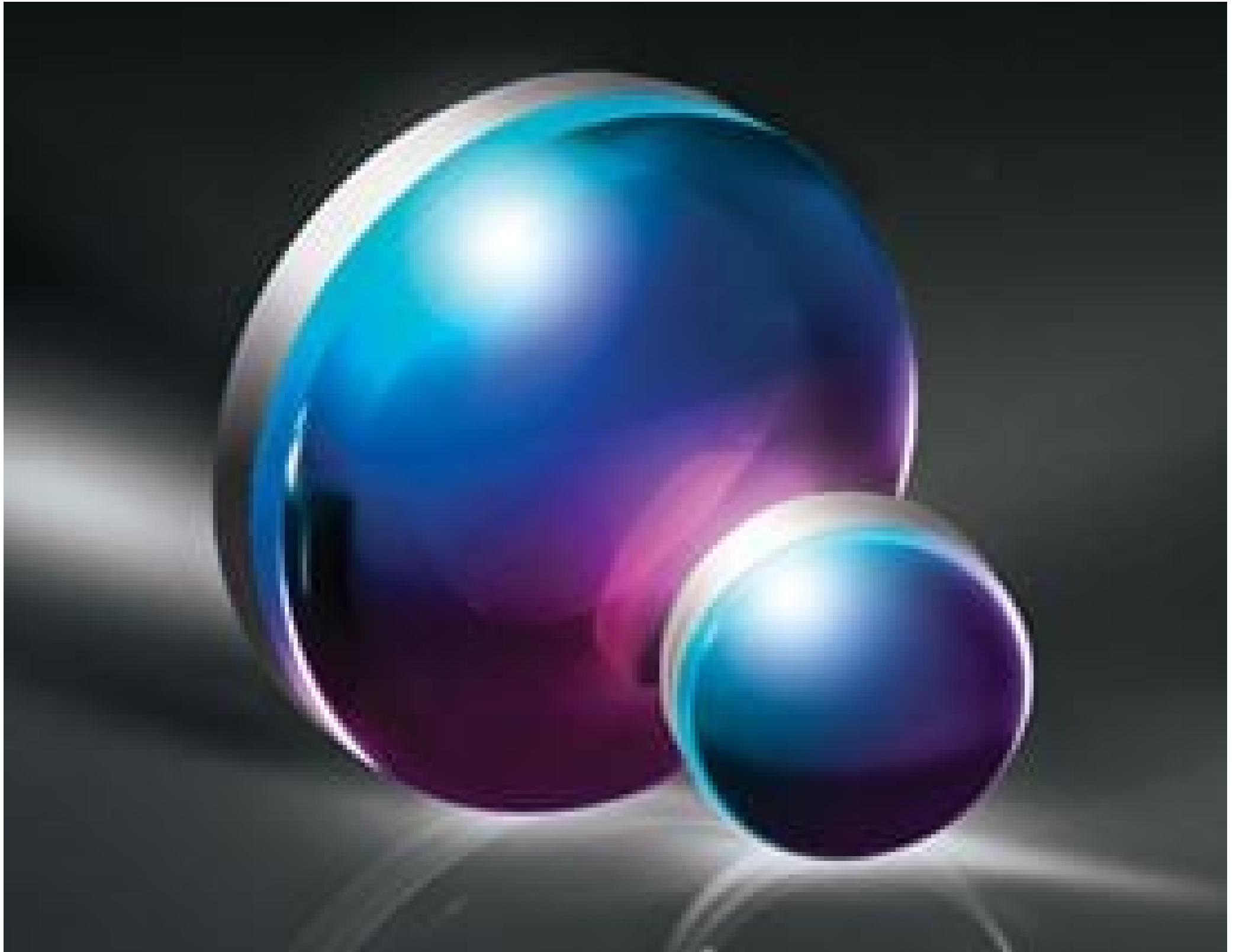
YAG-BBAR Coated Double-Convex (DCX) Lenses