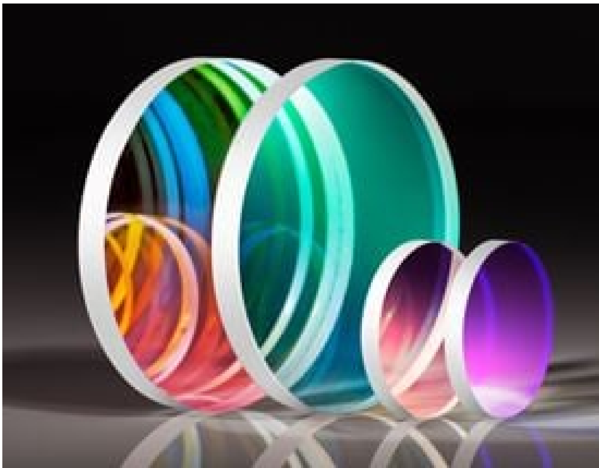
High Performance OD 4.0 Shortpass Filters