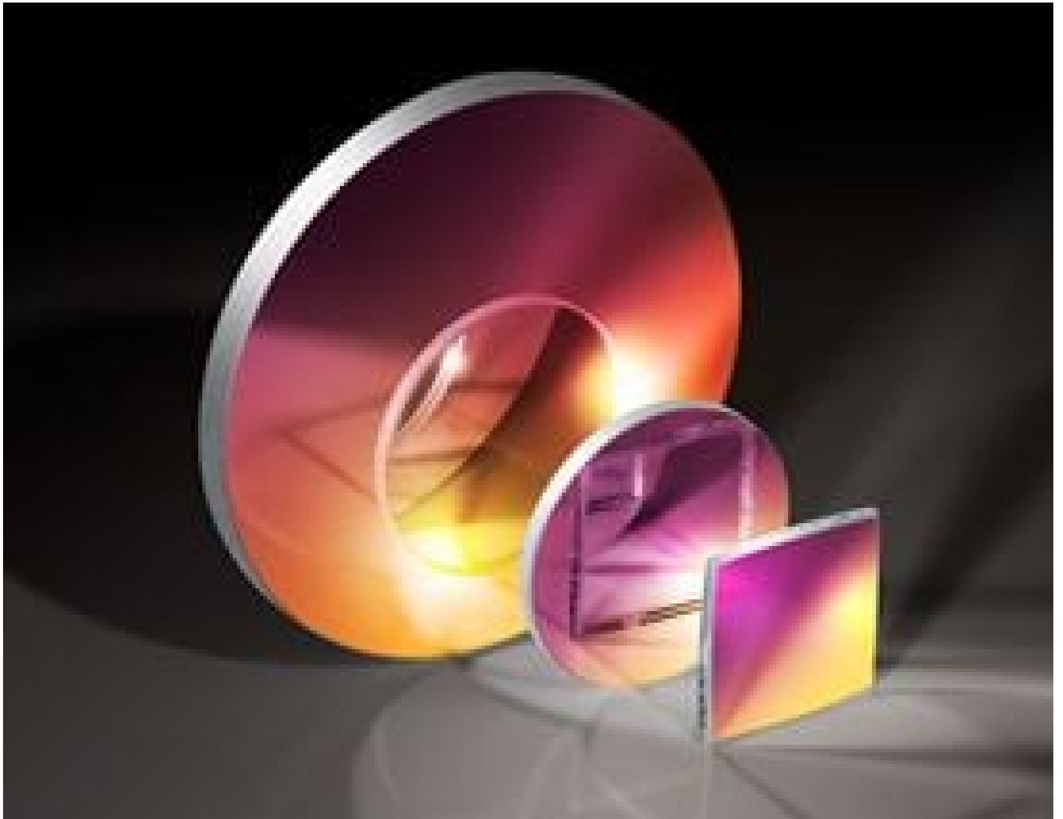
4-6 \lambda First Surface Mirrors