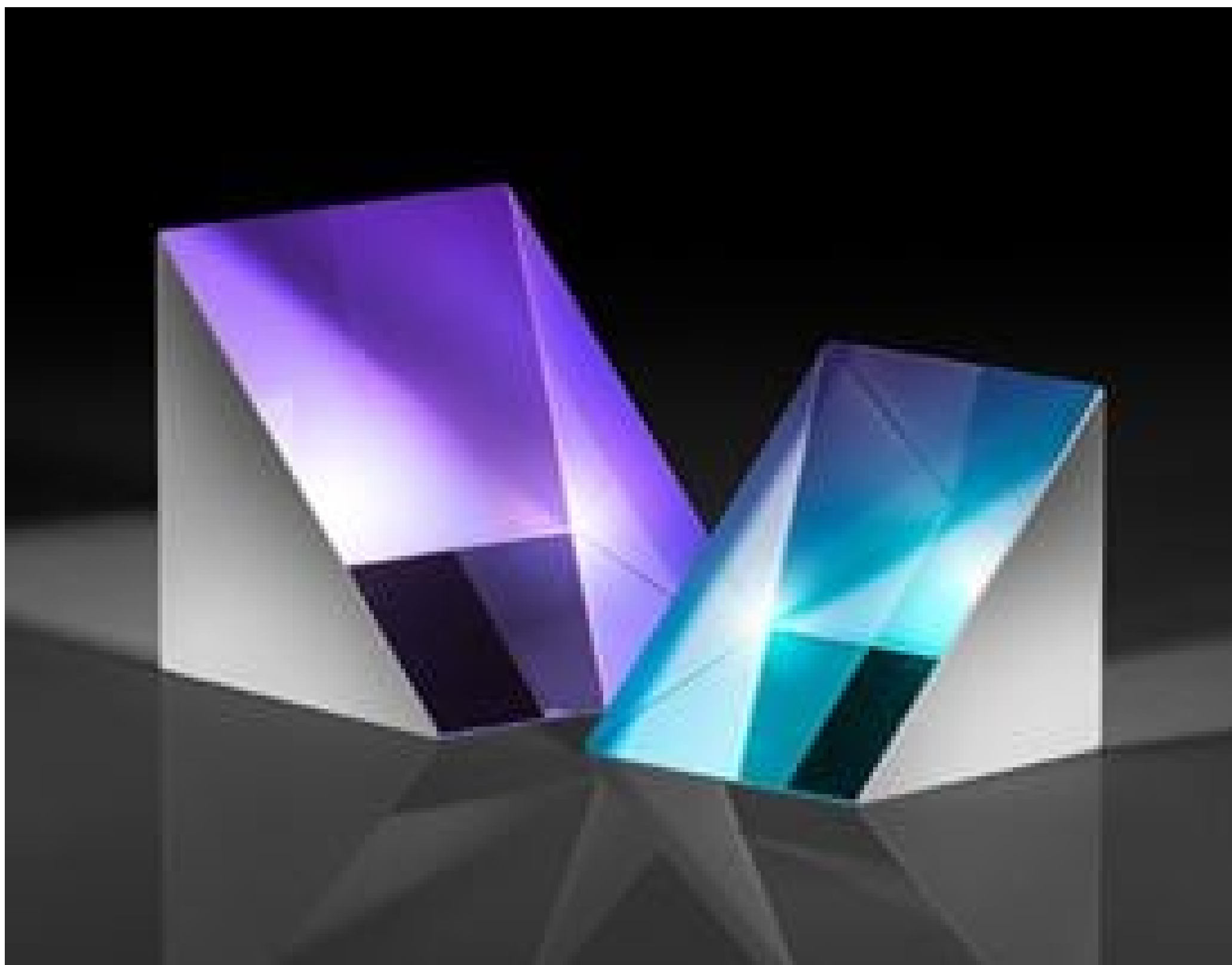
N-BK7 Right Angle Prisms