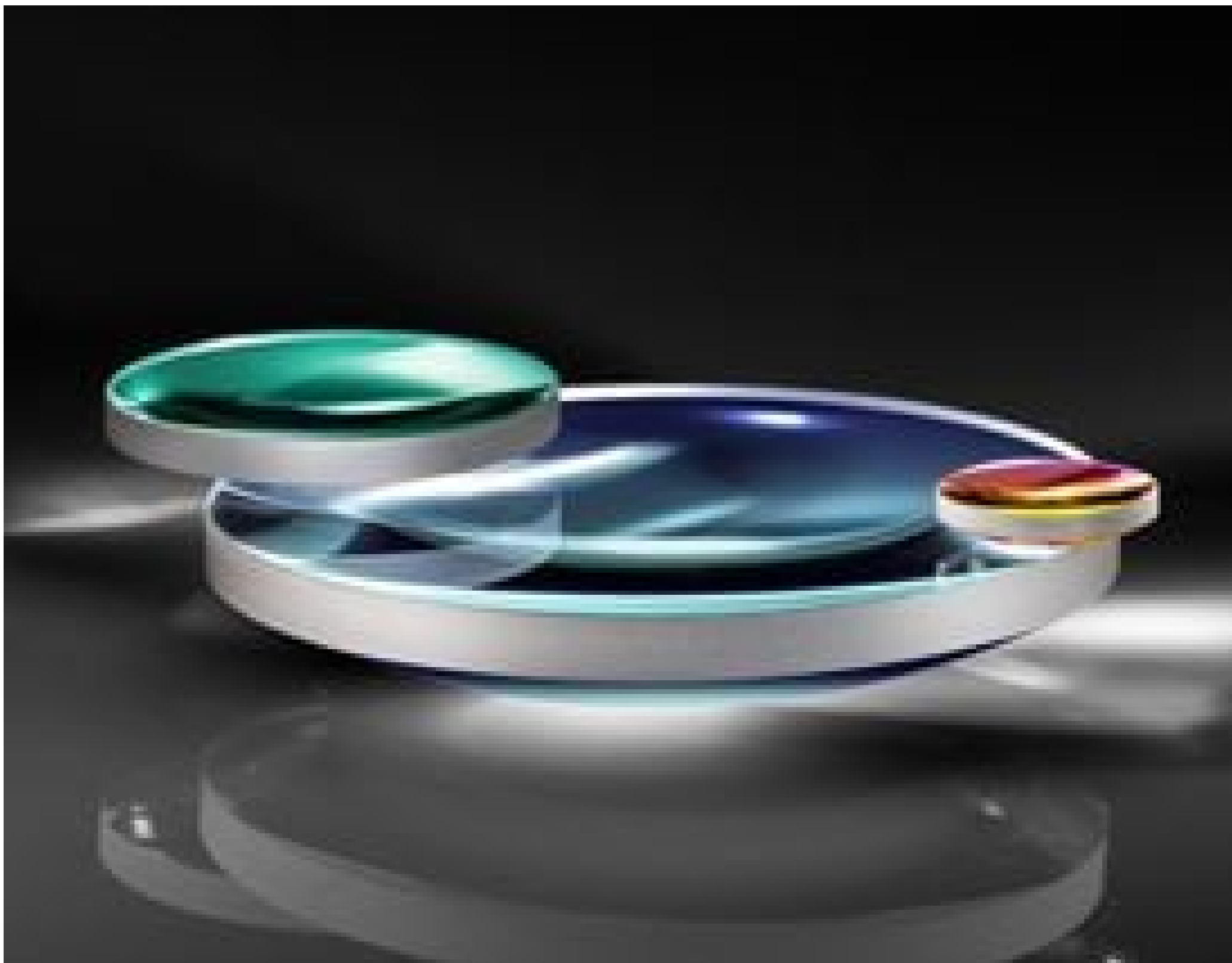
633nm Laser Line Coated Plano-Convex (PCX) Lenses