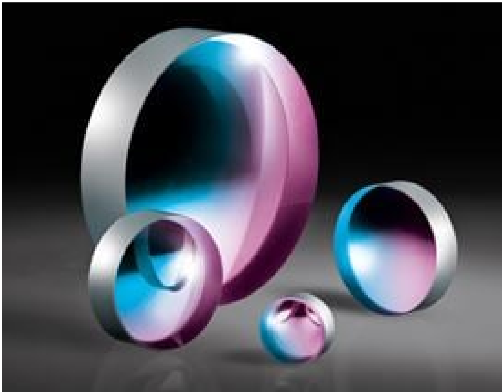
UV Fused Silica Plano-Concave (PCV) Lenses