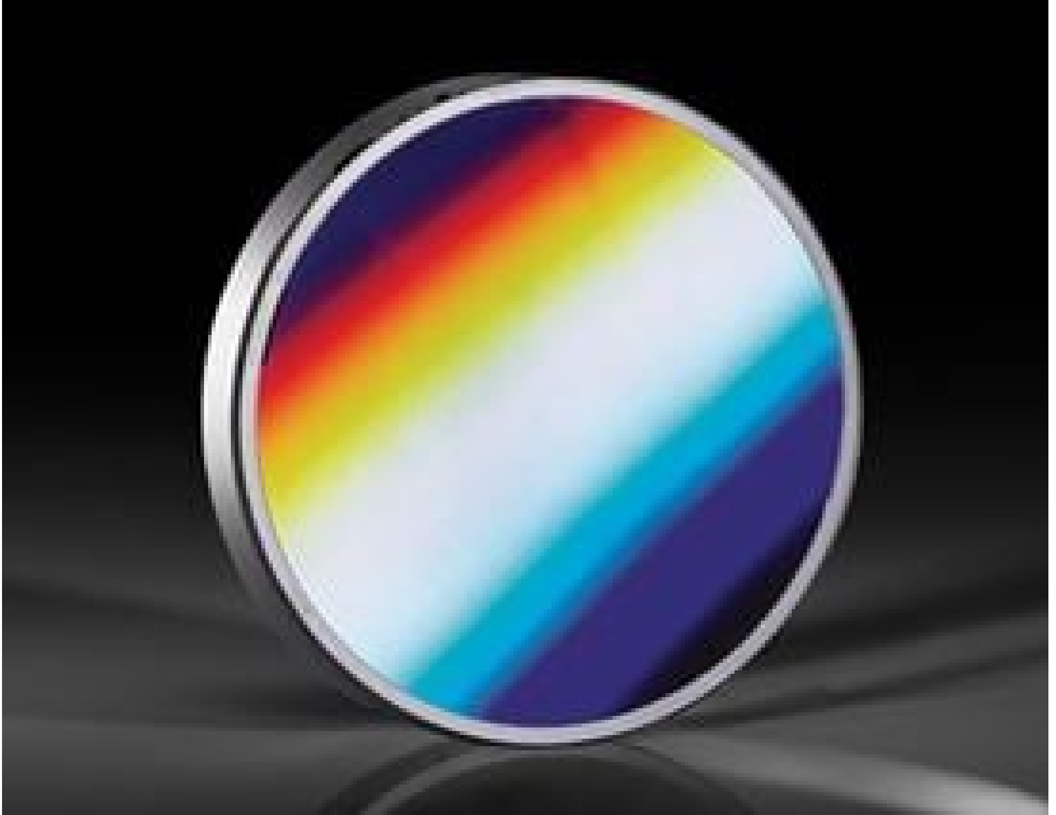
ZEISS Concave Diffraction Gratings