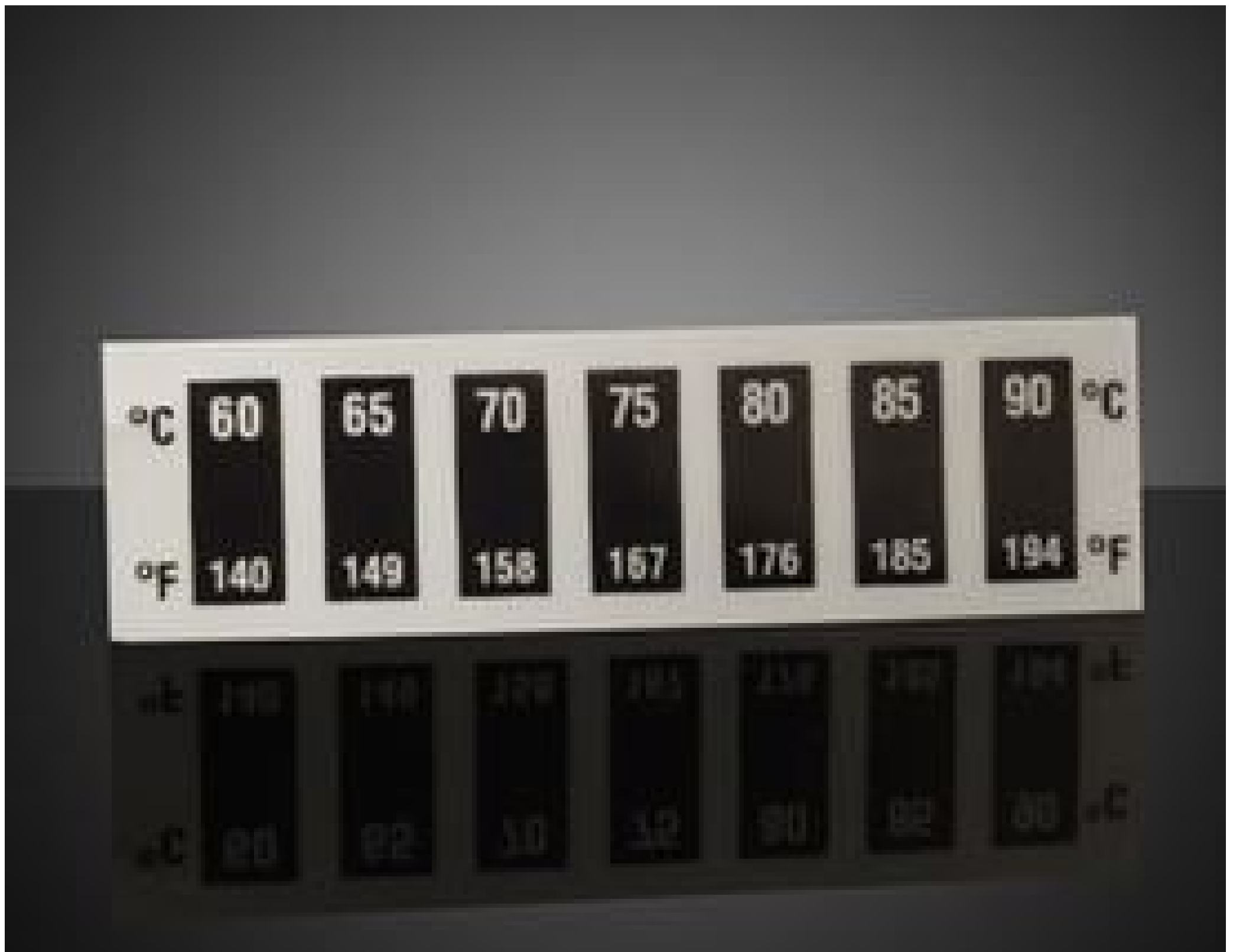
60 - 90°C Temp Range, Liquid Crystal Thermometers (10/Pack)