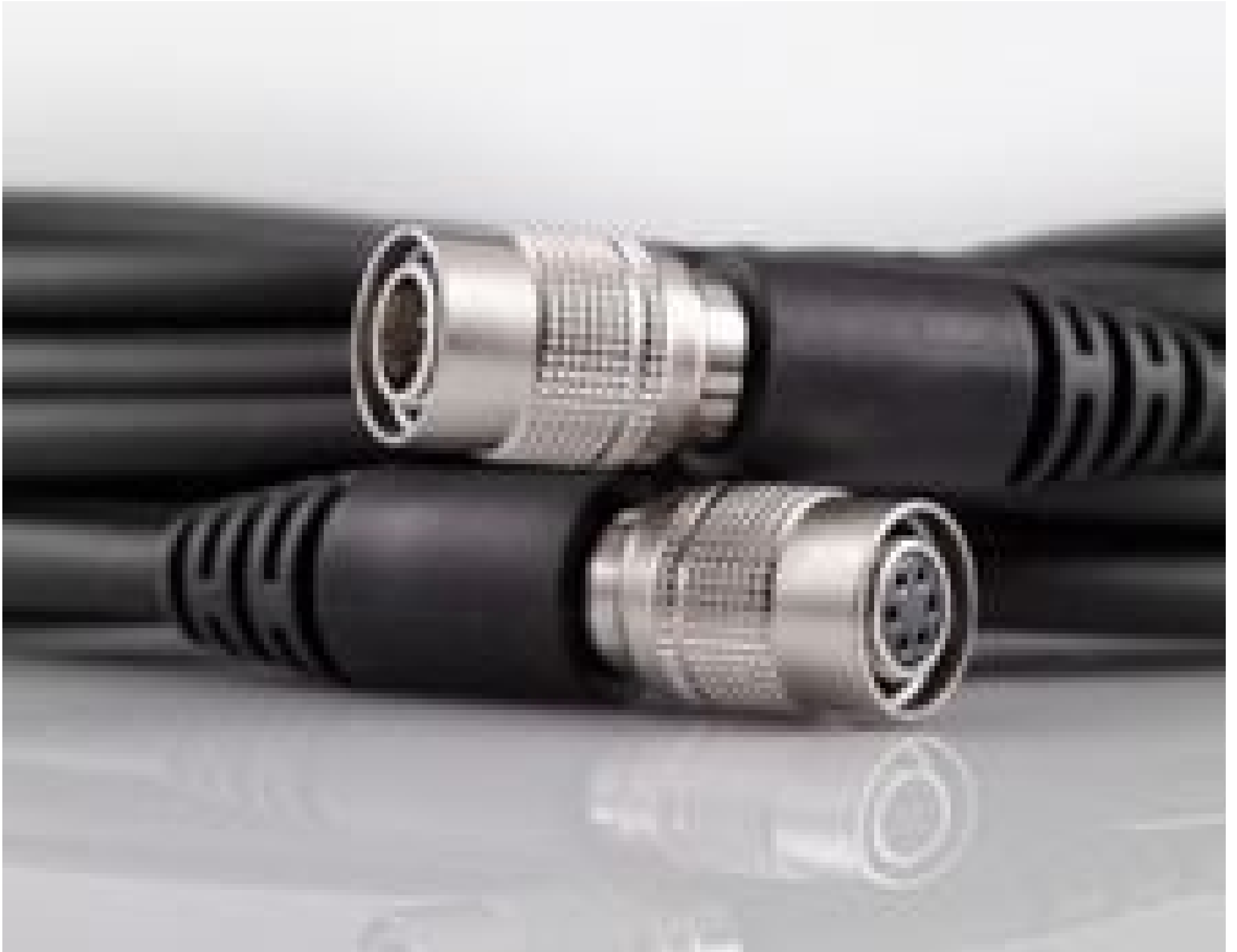
6-way Hirose Male/Female Cable