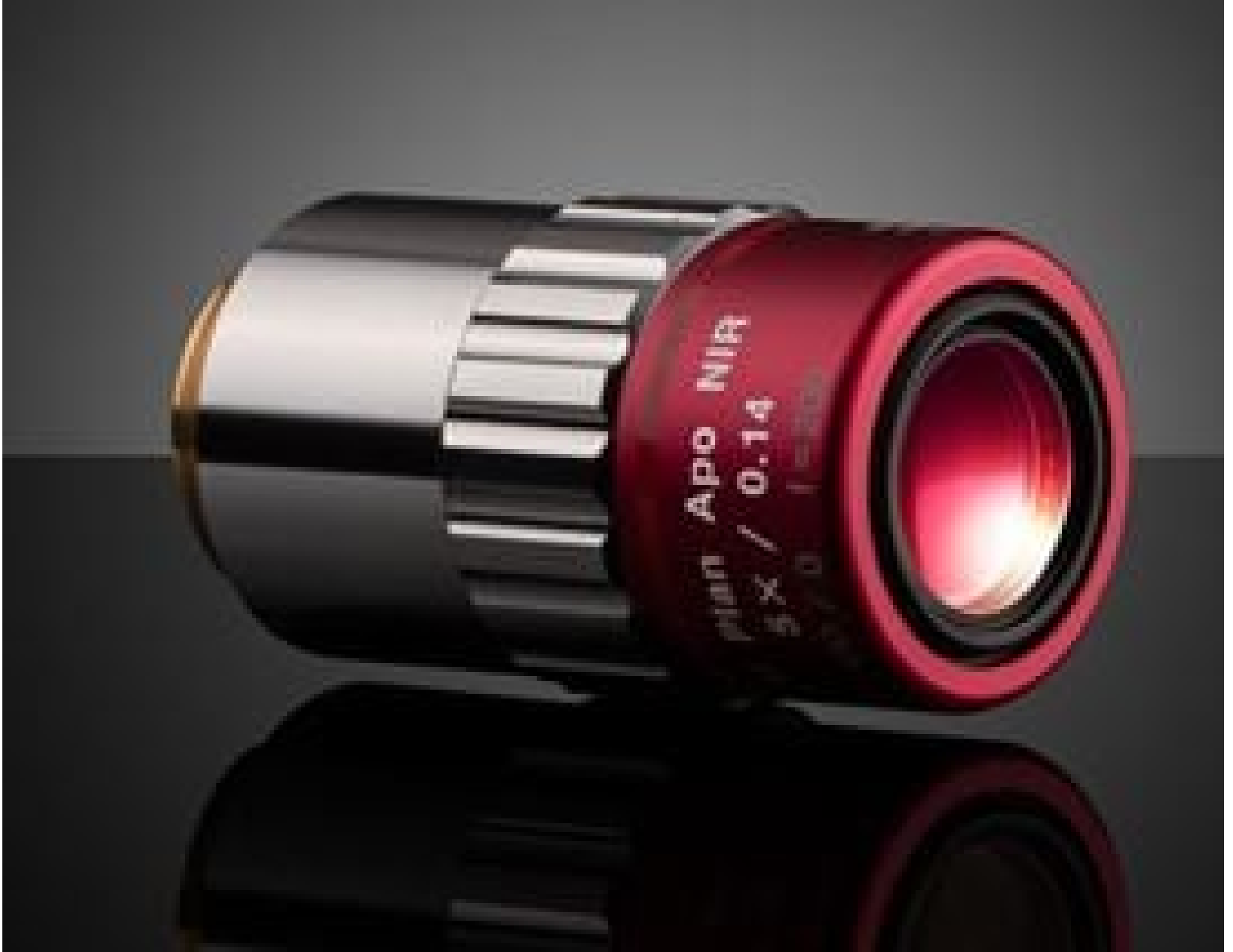
5X Mitutoyo Plan Apo NIR Infinity Corrected Objective, #46-402