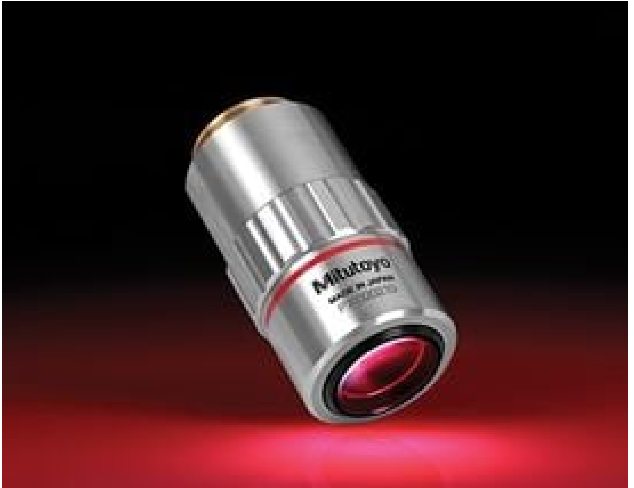
5X Mitutoyo Plan Apo Infinity Corrected Long WD Objective, #46-143