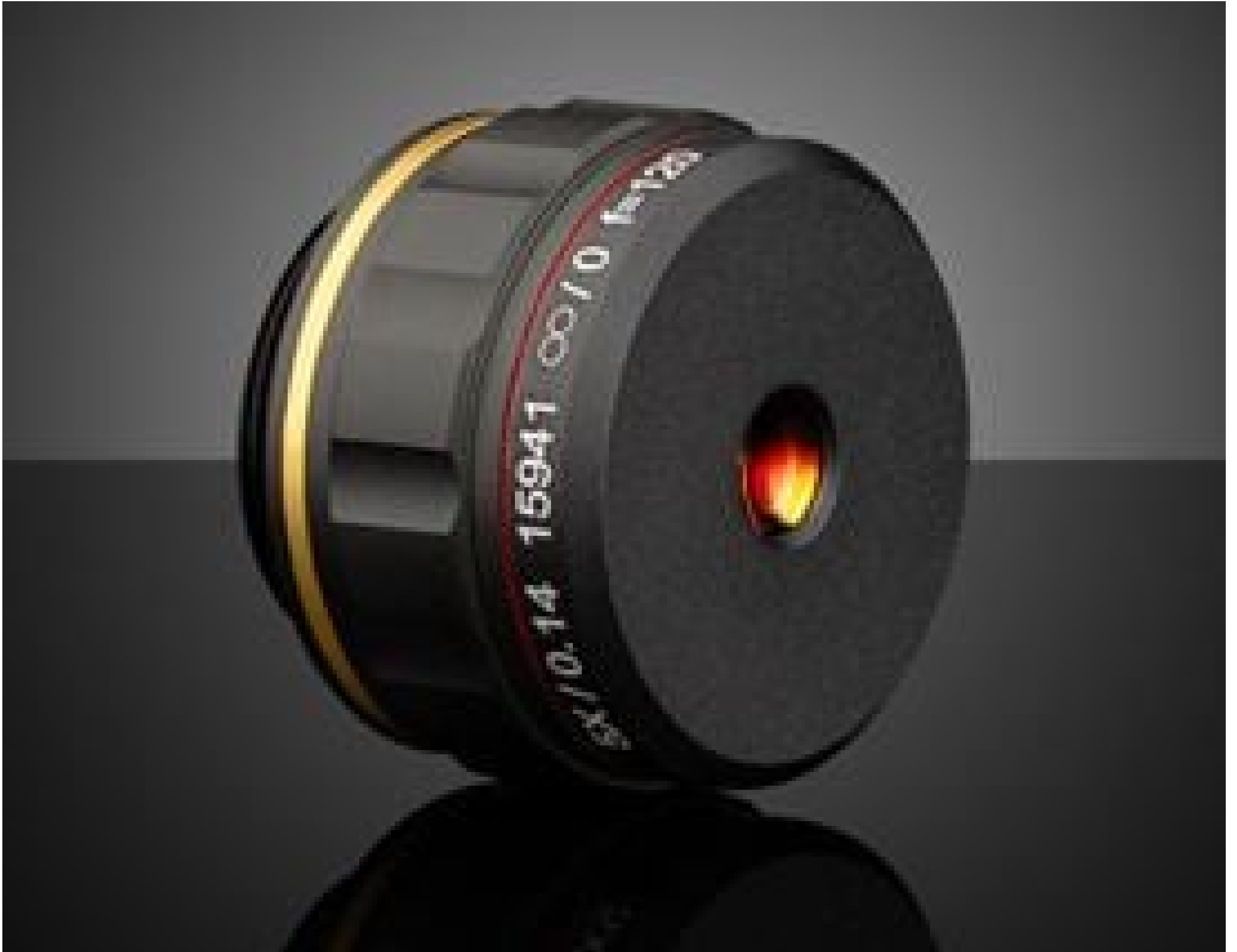
5X 120i Plan APO Infinity Corrected Objectives