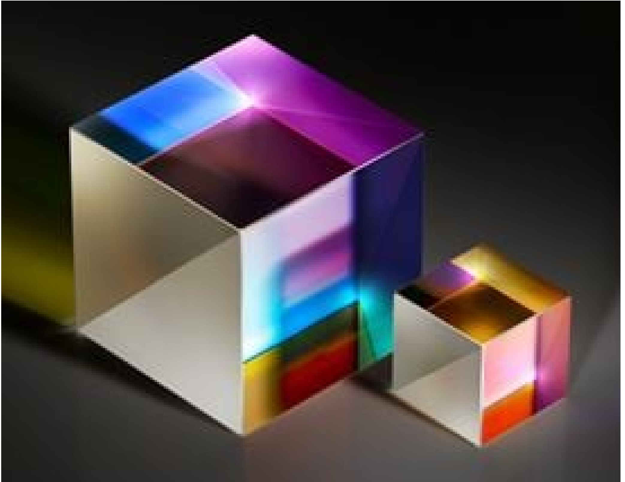
TECHSPEC® Broadband Polarizing Cube Beamsplitters