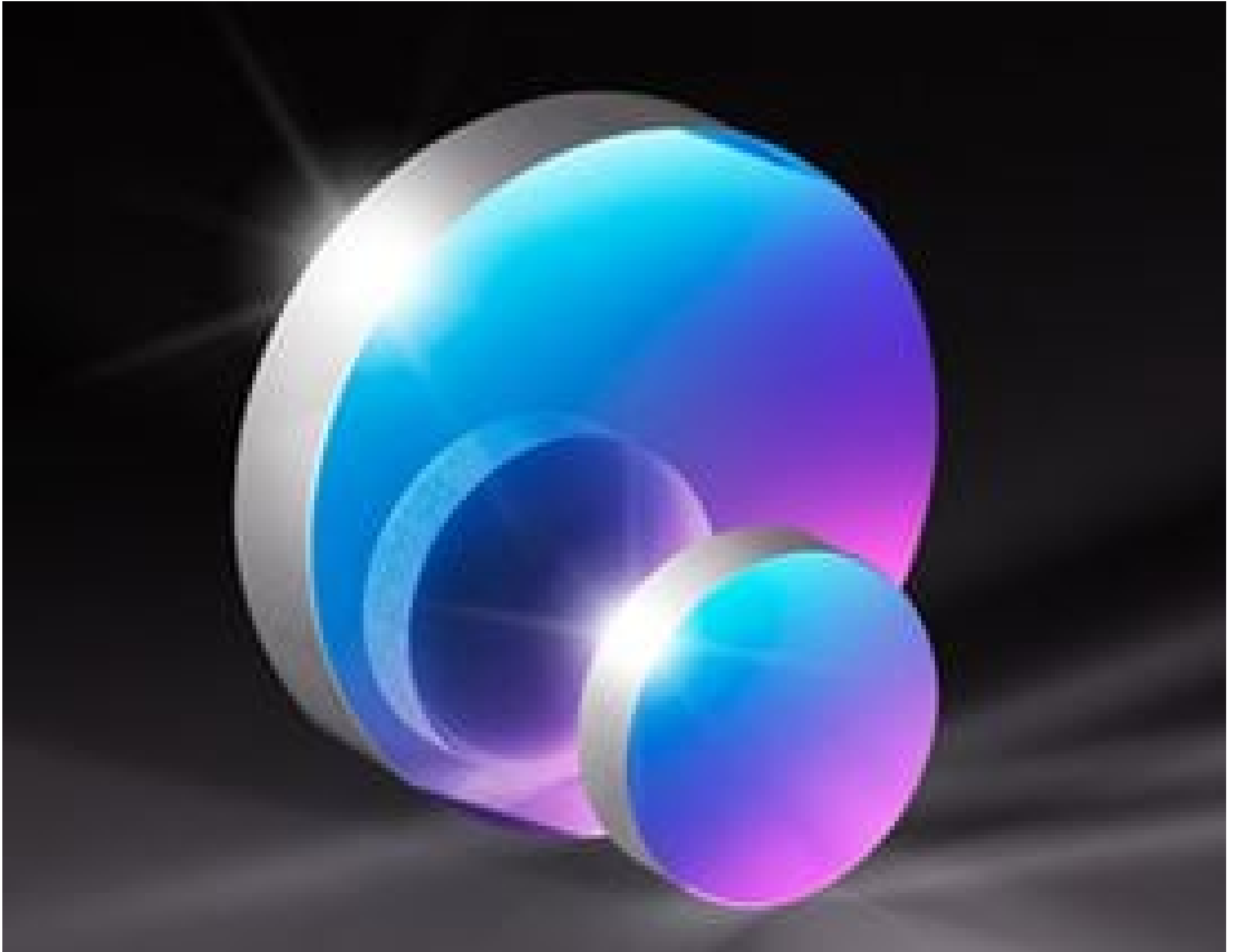
Precision Ultraviolet Mirrors