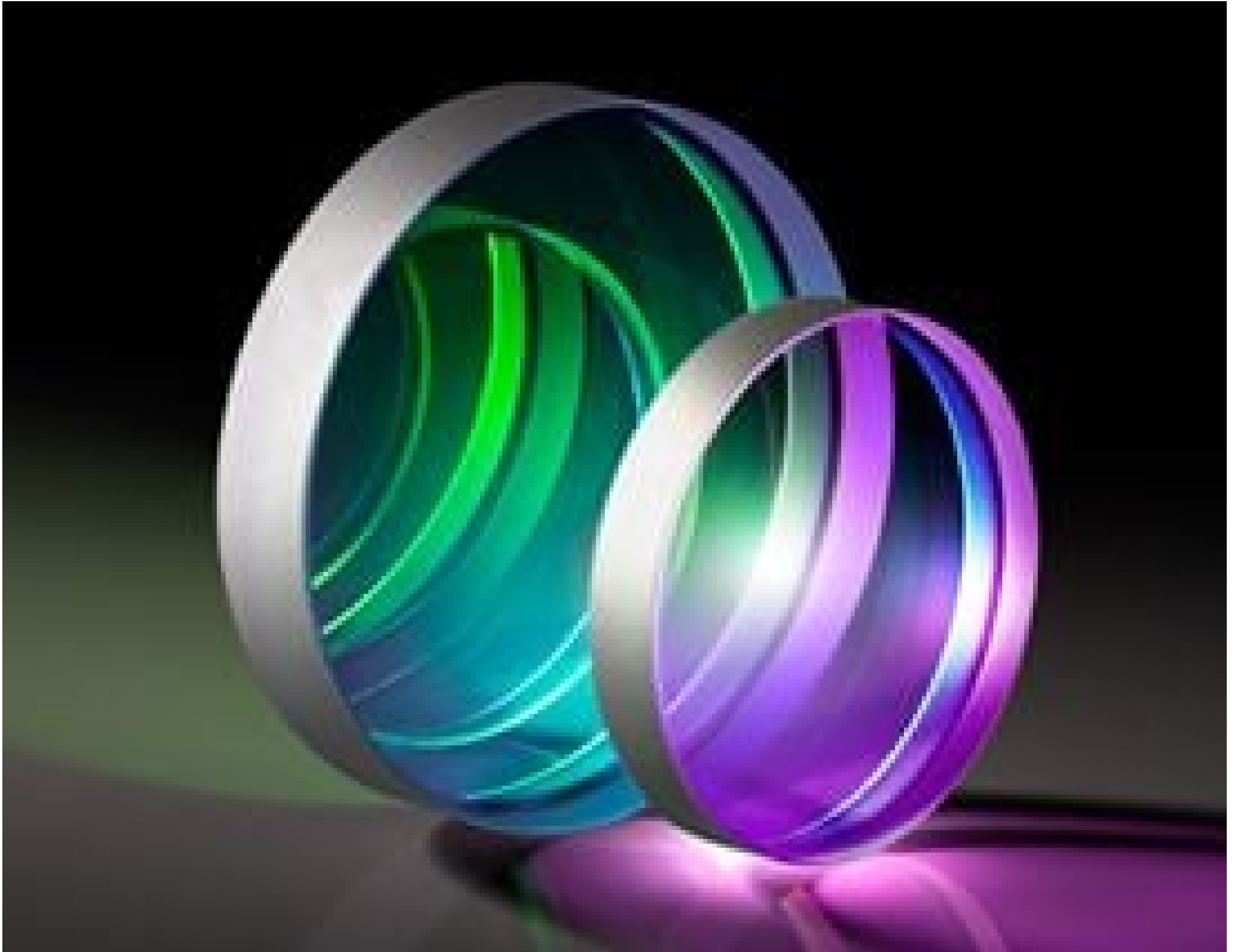
TECHSPEC® Nd:YAG Laser Output Couplers