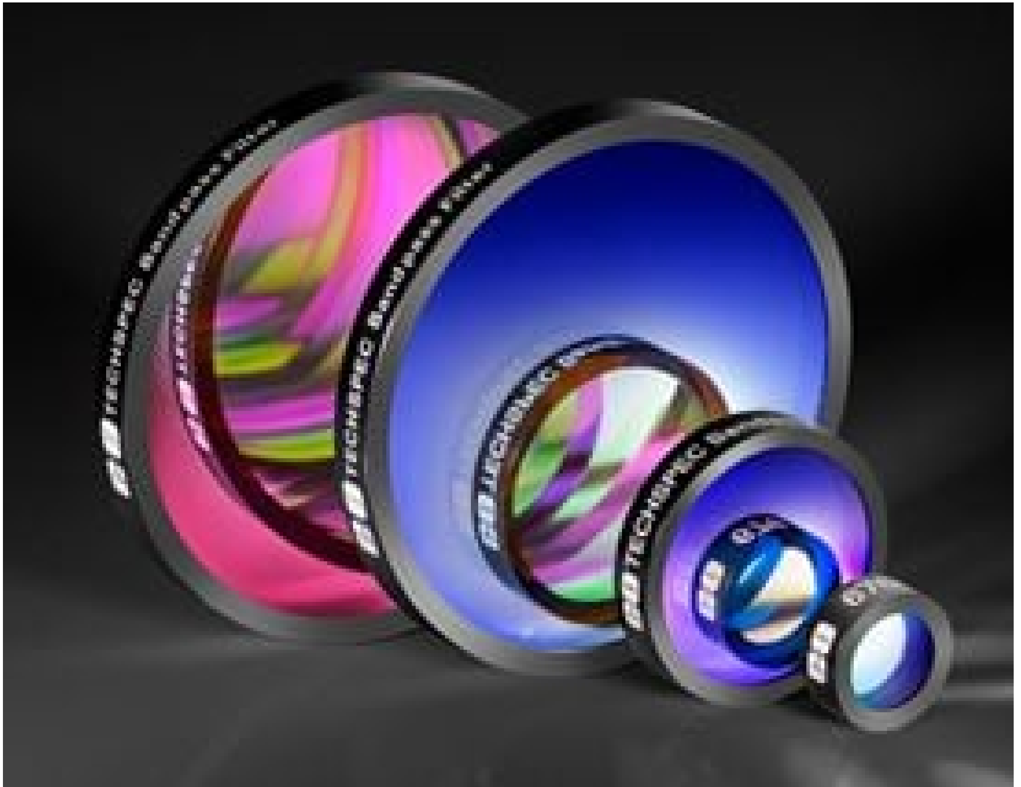
TECHSPEC Hard Coated OD 4.0 10nm Bandpass Filters