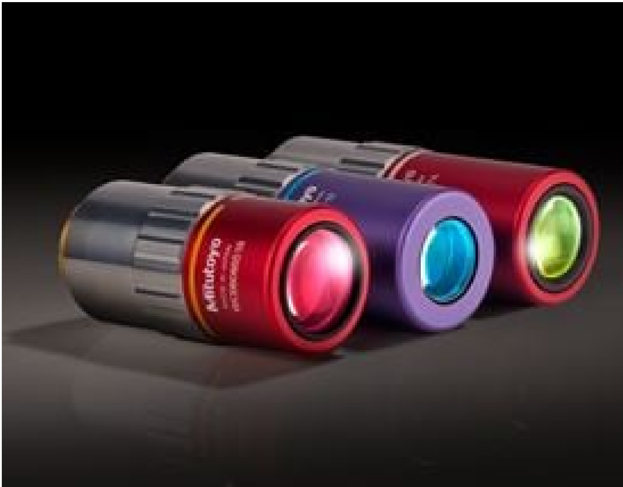
Mitutoyo NIR, NUV, and UV Infinity Corrected Objectives