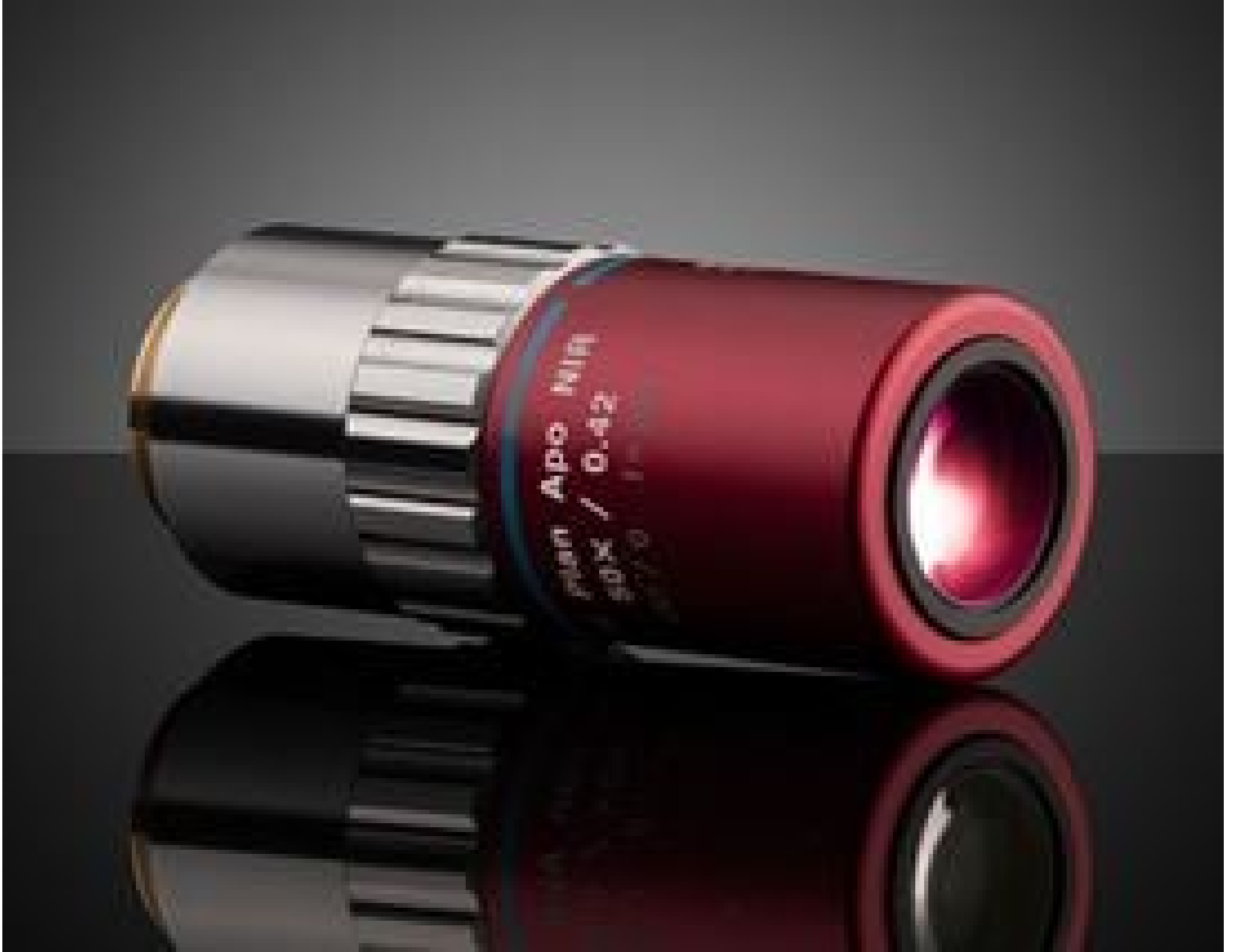
50X Mitutoyo Plan Apo NIR Infinity Corrected Objective, #46-405