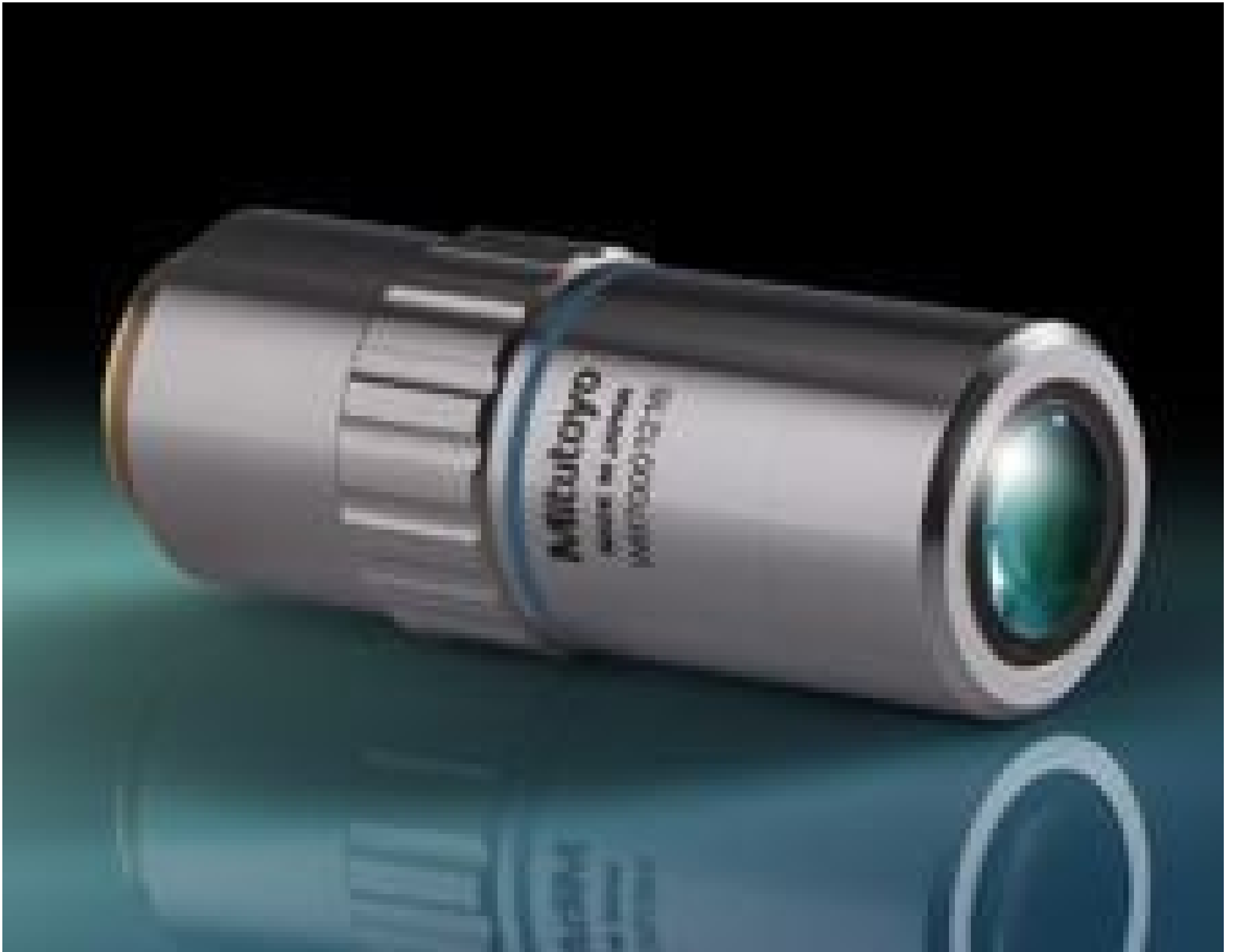
50X Mitutoyo Plan Apo Infinity Corrected Long WD Objective, #46-146