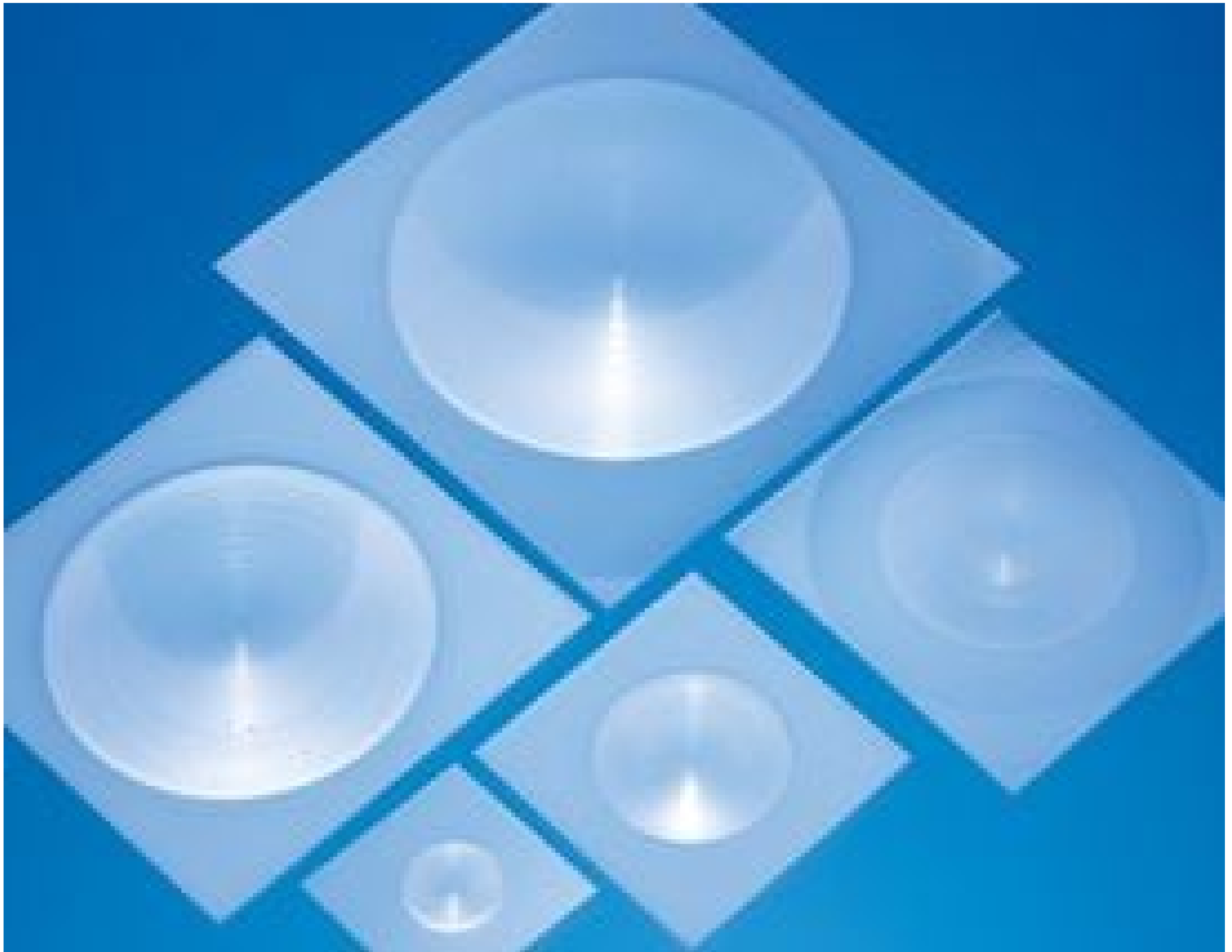
Infrared (IR) Fresnel Lenses