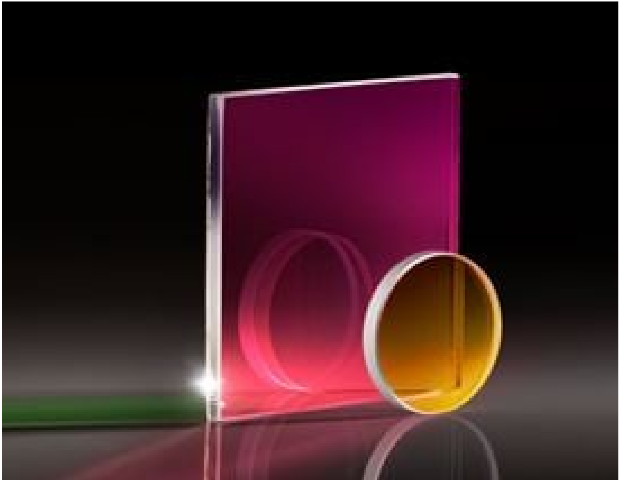
Extended Hot Mirrors