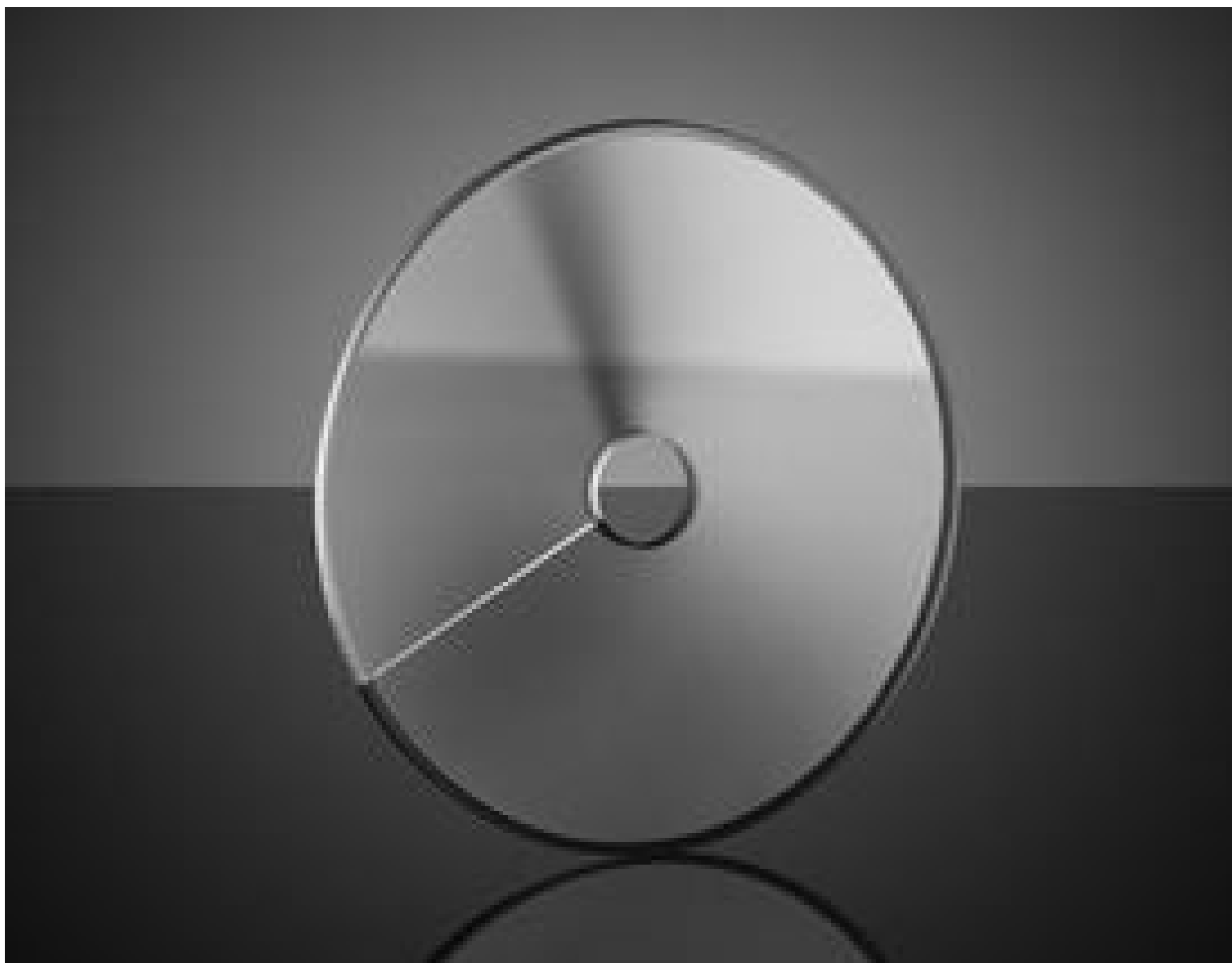
Unmounted Circular Variable Neutral Density (ND) Filters