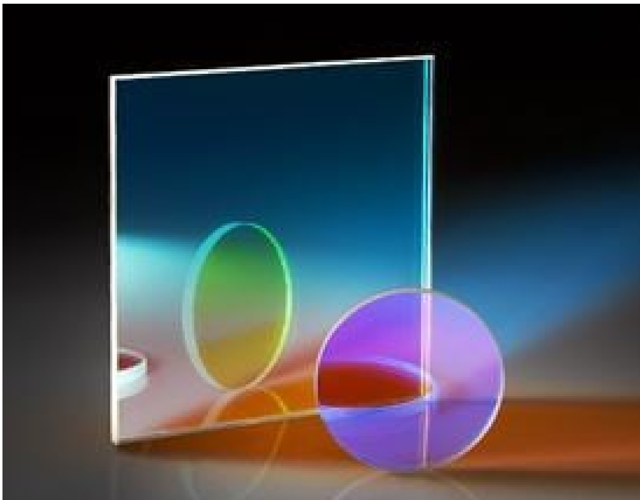
Additive and Subtractive Dichroic Color Filters