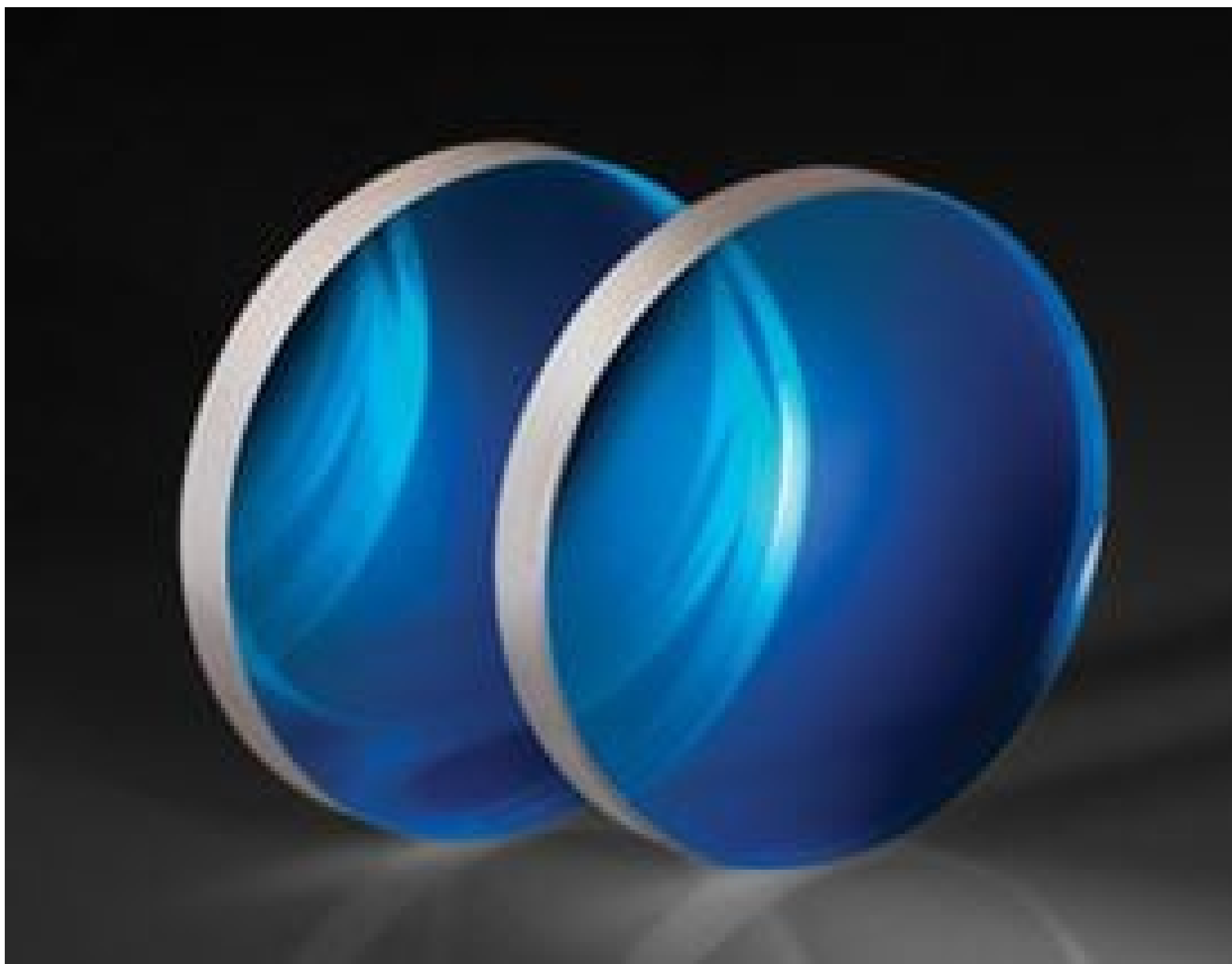
TECHSPEC® \lambda/10 Plate Beamsplitters