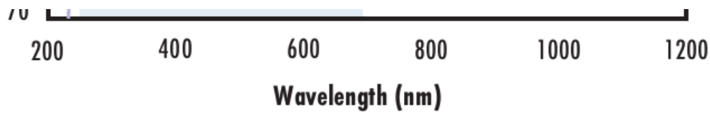
Fused Silica with VIS-EXT Coating Typical Transmission