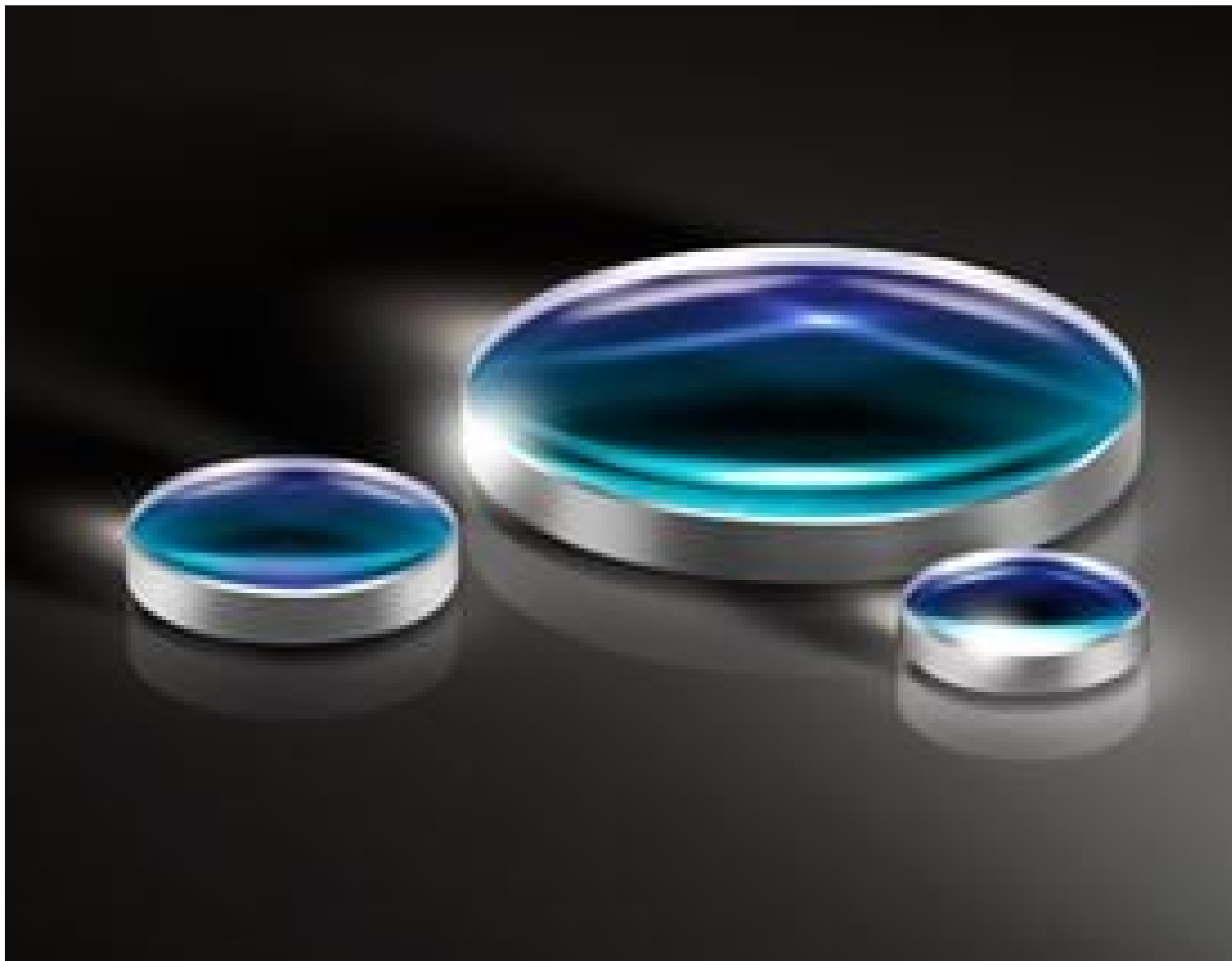
UV Fused Silica Double-Convex (DCX) Lenses