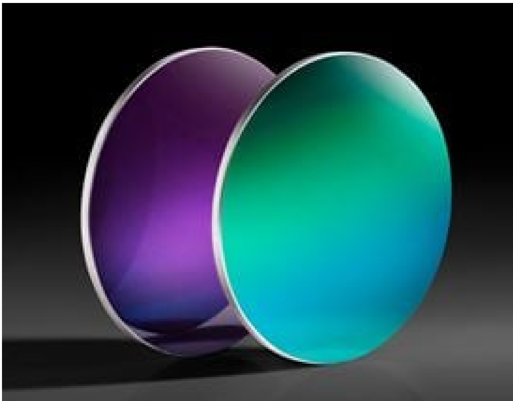
TECHSPEC Silicon (Si) Windows